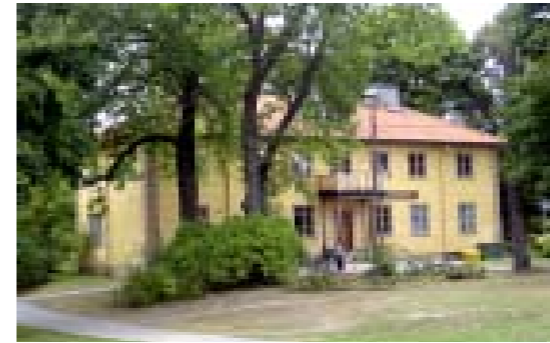
5. Bodals gård