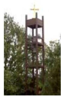
7. Bodals kyrka