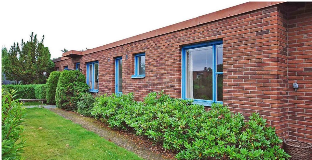
Kvarteret Yxans låga kedjehus.

med panel och glasruta. Tomtkaraktären kan ofta bli mer sluten mot gatan i kvarteret Yxan på grund av husens låga volym samt uppvuxna buskage och häckar.