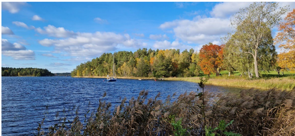
Södergarnsviken vid Södergarn.

Södergarn ligger där Elfviklandet börjar i nordost och har ett avsides läge. Här fanns en liten gård med medeltida ursprung i skydd av viken. Först på 1700-talet utvecklades gården mer och Södergarns första stora blomstringstid utvecklades. I samband med den byggdes Falkmanska villan, en grosshandlarvilla som byggdes under det sena 1800-talets sommarvillaeppok. Handelsbanken hyrde 1929 Södergarn för att erbjuda sin personal ett rekreations- och semesterhem i lantlig miljö och 1944 köpte banken hela fastigheten. Sedan 1962 är Södergarn säte för en av Lidingös många kursgårdar.