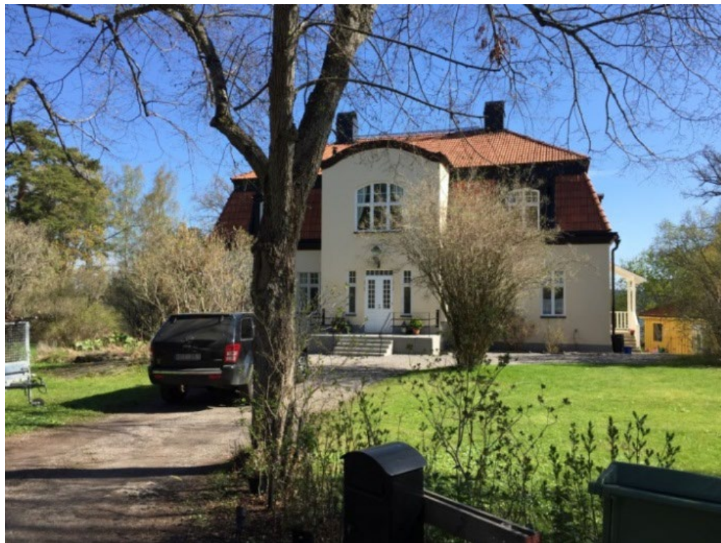
Stora Marielund präglas av det tidiga 1900-tales jugendstil, och byggdes i samma tid som Lidingö Villastad.

annat en slät ljus putsfasad, en stor välvd risalit med entré och små burspråk, tätspröjsade flerluftsfinster i bågförm under ett tegel- och plåttäckt valmat brutet tak. 1908 byggdes även ett litet lusthus i panelarkitektur åt sjösidan.