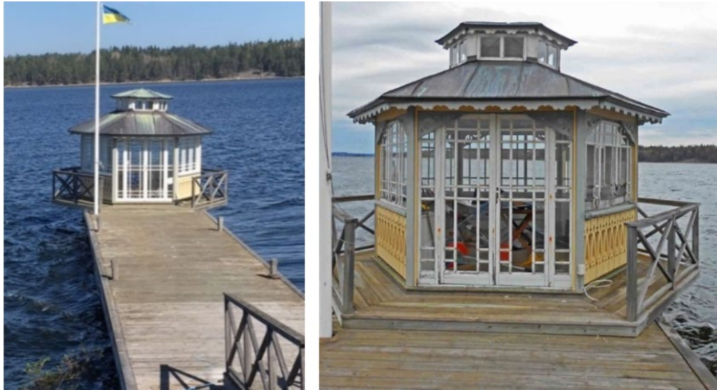
På stora Björkudden finns badhuset kvar längst ut på bryggan, vilket är ovanligt.

Även om kulturmiljön i huvudsak utgörs av de byggnader som fortfarande speglar sommarnöjesepoken finns ett par byggnader med en avvikande utformning som också är viktiga i den kulturhistoriska miljön. Villa Rutsdal uppfördes av stumfilmsregissören Mauritz Stiller 1923 och har en lätt nationalromantiskt influerad panelarkitektur. Den nätta byggnaden har liggande fasspontpanel i röd slamfärg, tegelklätt sadeltak och tätt spröjsade fönster med fönsterluckor. På tomten byggdes även en grindstuga som i dag används som garage.