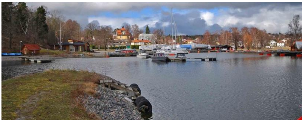
Vy från södra piren in mot Breviks hamn.

Gårdens sjöfart upphörde helt i och med att Breviks herrgård såldes och då Fastighetsbolaget Lidingö-Brevik bildade nya planer för utbyggnaden av Breviks villastad vilket även berörde hamnens framtid. Fastighetsbolaget var angeläget om att utveckla och förbättra kommunikationerna och anlade därför en brygganläggning och en båthamn efter ritningar av den välkände arkitekten Ferdinand Boberg. Delar av det tidiga 1900-talets hamnanläggning återstår i den nuvarande anläggningen som moderniserats under senare år. Nya pirar och förtöjningsbryggor har tillkommit liksom bodar och klubblokaler för maritim verksamhet. På senare år har hamnen byggts ut till en större småbåtshamn.