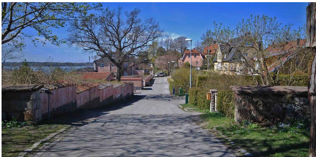
Grindstigen går västerut från Högbergas port mellan villorna i kvarteret Högudden.

På ovasidan av Sjöstigen ligger villorna bland bergknallar uppe i den branta sluttningen. På nedre sidan av gatan, i kvarteret Utsikten, ligger villorna lågt nere i sjösluttningen, orienterade ut mot sundet. Karaktärsfulla inslag kring Sjöstigen är äldre villatomter med trädgårdar, höga stödmurar och terrasseringar, framför allt anläggningen i sluttningen på Högudden 1. Stenmurar, klippta häckar eller traditionella spjälstaket avgränsar flera villatomter mot Sjöstigen och Grindstigen.