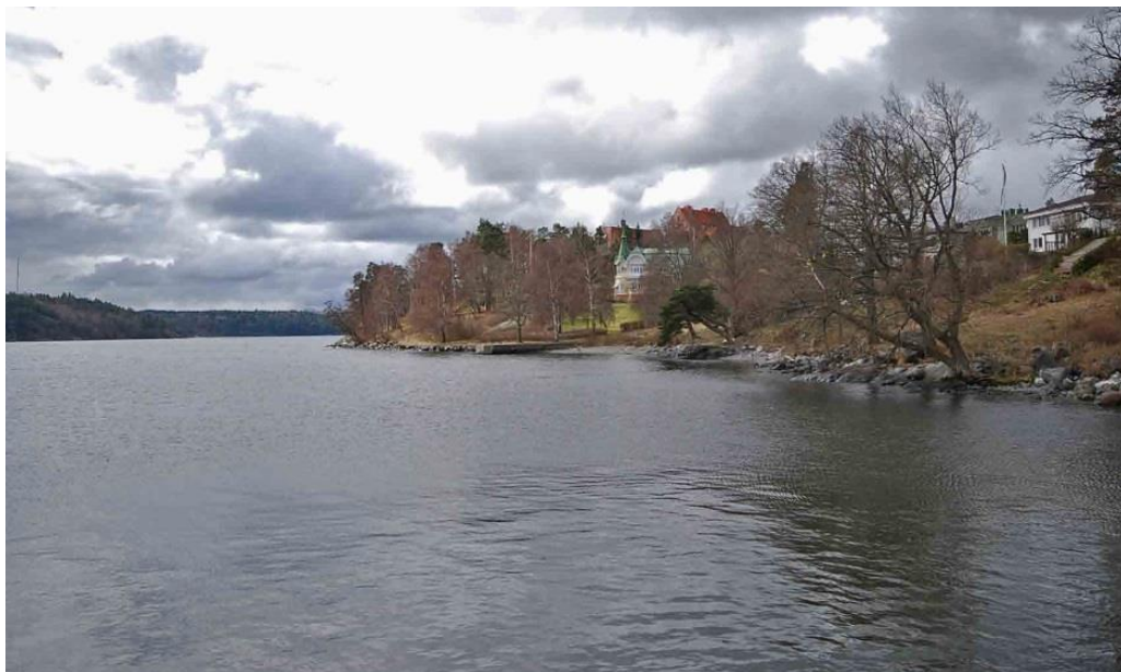
Vy från Halvkakssundet upp mot Villa Högudden och Högberga gård.

Högudden samt närmast anslutande delar av kvarteren Alpen och Kullen. Sjöstigen förenar därmed även Villa Roskull i sydväst och Villa Högberga i sydost som båda ligger som stora röda tegelborgar i exponerade lägen högt över farleden mot Stockholm.