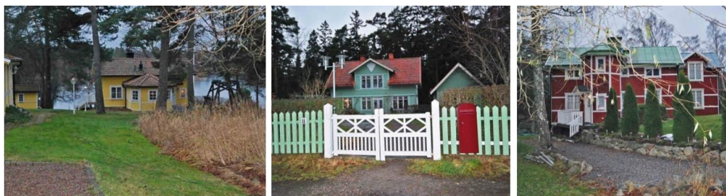
F.d. sommarvillor; Egilsborg 1, Lidingö 9:110 och Fridhem 1.

Trasthagen och den stora södra husklungan innanför Kottlasjön. På norrsidan av den grusade lilla vägen ligger villorna i gles rad, placerade mellan skogen och vägen, omgivna av uppvuxna villatomter, inte sällan med traditionellt utformade spjälstaket mot vägen. Vy mot den ena av de två villor på Alphyddan 1 som hör till Trasthagens mest välbevarade äldre villor i dag.