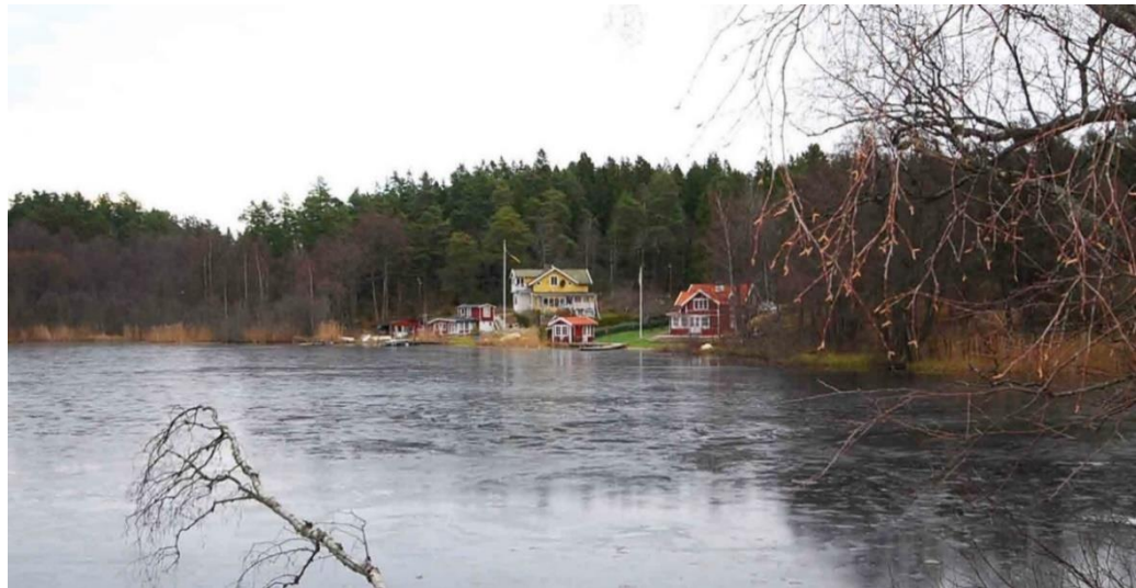
Trasthagen. Den norra mindre husklingan vid Pennaflod och Stockbysjön. Vy från Fyrverkerifabriken.