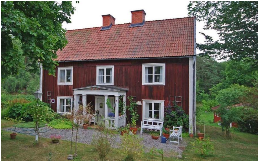
Rudboda Gårds sannolikt äldsta bostadshus, troligen med rötter i 1700-talet, har senare använts som statarbostad. I dag den enda bevarade i sitt slag på Lidingö.

Rudalid strax sydost om Rudboda gård uppfördes vid början av 1900-talet som en sommarvilla i tidstypisk panelarkitektur. I den äldre husdelen har villan kvar ursprungliga fasadpartier, bland annat glasverandor, men är i övrigt starkt till- och ombyggd.