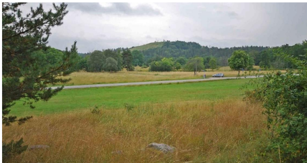
Sundby gårdstomt, vy mot söder. (Raä Lidingö 36:1)

Rudboda gårds skriftliga omnämmande 1381 är kopplat till ett köpebrev. Gården kan mycket väl ha kvar ett medeltida gårdsläge, beläget på en förhöjning ovanför viken, vars vatten då gick högre upp än i dag. Nuvarande gårdsmiljö som byggdes upp av grosshandlare Lemke i tidigt 1800-tal är en av de bäst bevarade äldre gårdsanläggningarna på Lidingö.