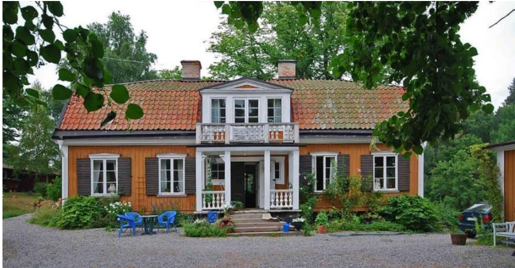
Rudboda gård är en av Lidingös mest genuina och väl bibehållna agrara gårdsmiljöer med byggnader uteslutande från 1800-talet. Manbyggnaden från 1800-talets början fick sin huvudsakliga utformning på 1840-talet.