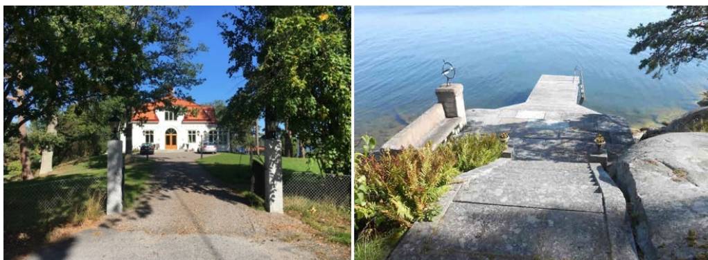
Lilla Räfviken huvudbyggnad och brygga.

På krönet ovanför vattnet ligger den stora trävillan Lilla Räfviken från 1902. Med sitt höga och fria läge är byggnaden karaktärsskapande i området. Villan har tydliga jugenddrag i sina högt uppdragna bågformade frontespiser samt sitt ståtliga entréparti och originella listverk. Exteriören karaktäriseras bland annat av fasadens spåntade panel på växlande ledd, glasverandan, fönster med tätspröjsad överdel och det tegeltäckta valmade brutna taket. Villan har byggts till under sent 1900-tal, och även genomgått en del fasadändringar.