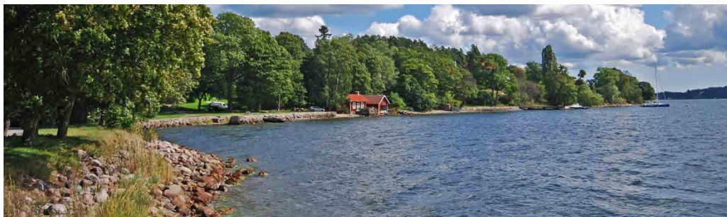
Elfvik, vy mot Elfviks gårds bygghus och båthus.

Jordbruksdriften vidareutvecklades sedan på 1890-talet. 1946 förvärvades Elfviks gård och en stor del av ägorna av Lidingö stad. Elfviks gård är i dag den enda verksamma jordbruksfastigheten på Lidingö.