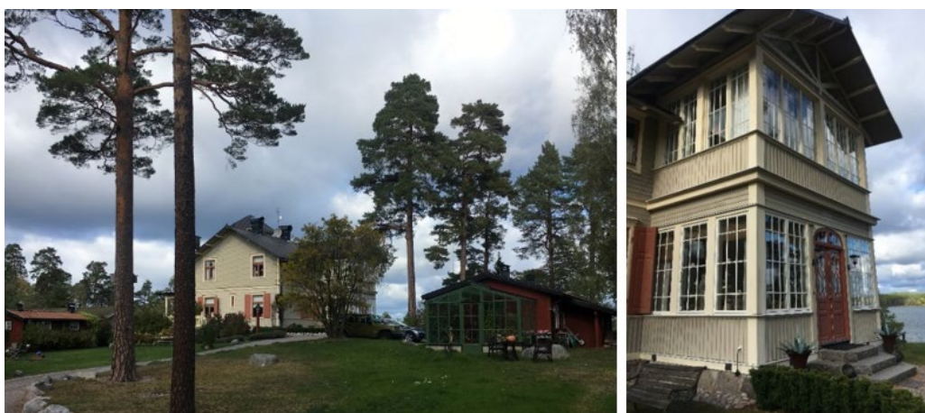
Bjälbo har ett högt och fritt läge med en vidunderlig utsikt mot fjärden.

Under senare delen av 1800-talet uppfördes sommarvillor på Elfviks marker, framför allt mot Hustegafjärden och Elfviksbukten i söder, men även mot Höggarnsfjärden i sydost. Flera villor såsom Kullen, Liden och Metsola byggdes i sjösluttningen mot Hustegafjärden. Några villor byggdes även kring Revviken (Rävviken) runt 1900 uppe i nordost med början i Bjälbo 1898. I anslutning till sommarvillorna uppfördes även en och annan sportstuga på 1920-1940-talet.