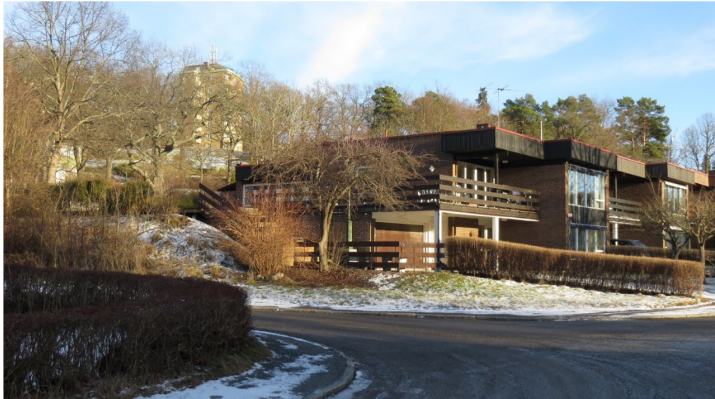
Ekbackevägen med Björnbos punkthus i bakgrunden.