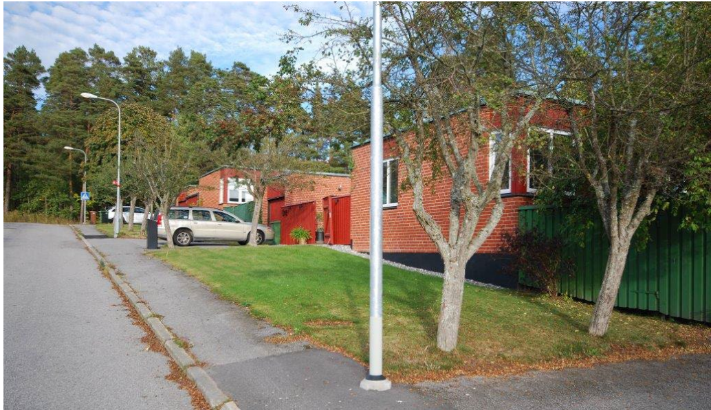
Atriumvillorna vid Boholmsstigen.