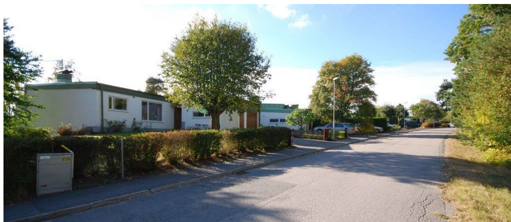
Radhusen på Ekorrvägen.

De trettio uniformt gestaltade radhusen längs Ekorrvägen ritades av arkitekten Ernst Grönwall 1962 och uppfördes i souterräng i fem kvarter på rad i sydvästsuttningen nedanför Näset. Lidingö hade sedan dispositionsplanen från 1943 ett nytt förhållningssätt vad gällde stadens fortsatta utbyggnad. Man ville se en blandad bebyggelse med olika boendeformer. Radhusen i området är tillkomna i det konceptet, de kompletterar flerbostadshusen uppe på Näset.