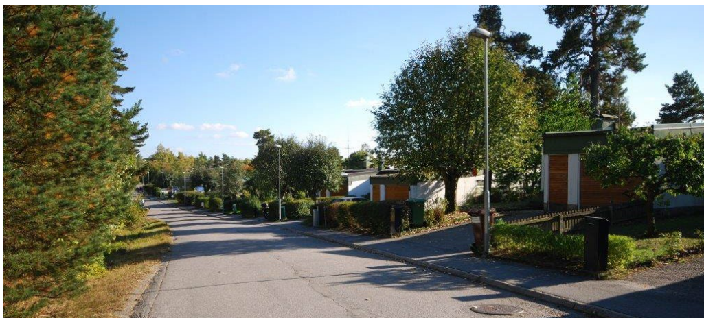
Radhusen på Ekorrvägen.

Radhusen är placerade snett mot Ekorrvägen och är sinsemellan likformigt sidförskjutna vilket skapar ett repetitivt, rytmiskt mönster. De små förgårdarna är enkla till sin karaktär, genomgående sparsmakade och välskötta.