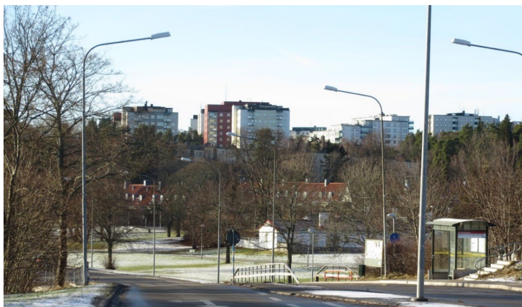
Bo gärde med låg bebyggelse och Näsets höghus i bakgrunden.

Den del av Näset som ligger norr om Norra Kungsvägen var obebyggd fram till 1950-talet förutom en mindre grupp med små villor. Diskussioner under tidigt 1940-tal om hur Lidingös framtid skulle utformas resulterade i en dispositionsplan med arkitekten Göran Sidenbladh och arkitekterna Ancker, Gate & Lindegren som upphovsmän. Planen, som var klar 1943, innebar att Lidingös stadsstruktur ändrades. Villastäderna skulle kompletteras med blandad bebyggelse och med olika boendeformer.