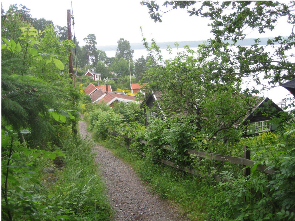
Grönstakolonin är samlad på ömse sidor av den smala bygatan.