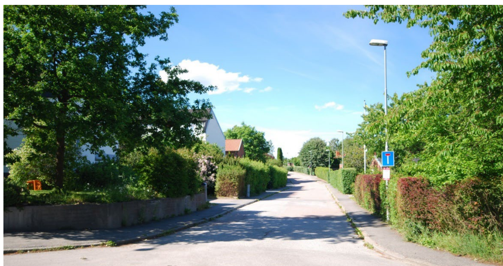
Häcken inramar gaturummet på Ankarvägen.

Bo gärde var till mitten av 1960-talet ännu en lantlig, agrar miljö. Bo gård med några ekonomibyggnader var i princip den enda bebyggelsen. Området kom att exploateras efter en stadsplan från 1957 som efter ändringar vann laga kraft 1961. Den är utformad av arkitekttrion Ancker, Gate & Lindegren, som också kom att rita flera av de radhus som uppfördes inom området. I norr planlades ett område kring Ankarvägen, som löper i en slinga upp på en höjd och som bebyggdes med exklusiva villor under 1960-talet.