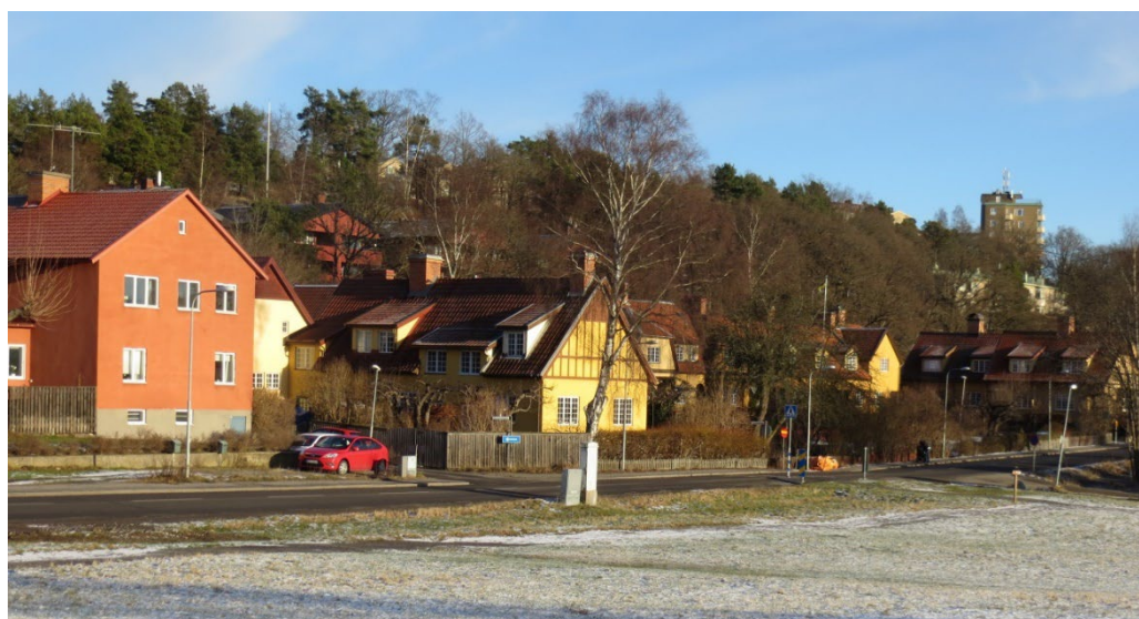
Kvarteret Fatburen till vänster och Canadaradhusen till höger.