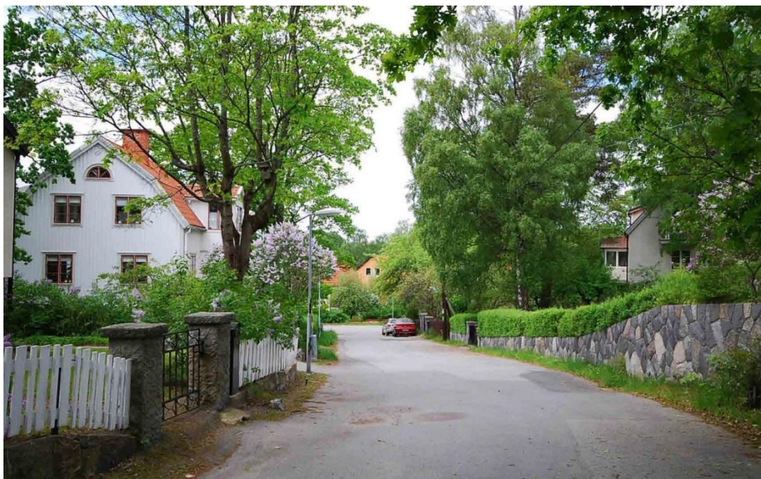
Orren 13 från 1925 är av mycket stor betydelse för upplevelsen av Storkvägens sluttning som en välbevarad liten villaenklav från 1920-talet.