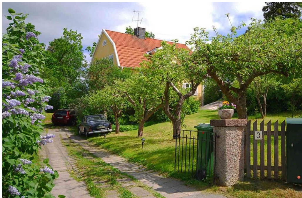
Mosstorp kännetecknas av småskalig villabebyggelse från ca 1920–1950. Husen inramas av fruktträdgårdar och syrenbuskage. På bilden ses Fasanen 9 från 1926.

Mosstorp kom i hög grad att få den karaktär som präglade många svenska städer under mellan- och efterkrigstiden, med villor och enstaka flerbostadshus. Här fanns många små verksamheter såsom mjölkaffär, specerihandel och cykelverkstad. På grund av 1900-talets bebyggelseutveckling med koncentrerade köpcentrum har verksamheterna försvunnit men karaktären finns fortfarande kvar i någon mån.