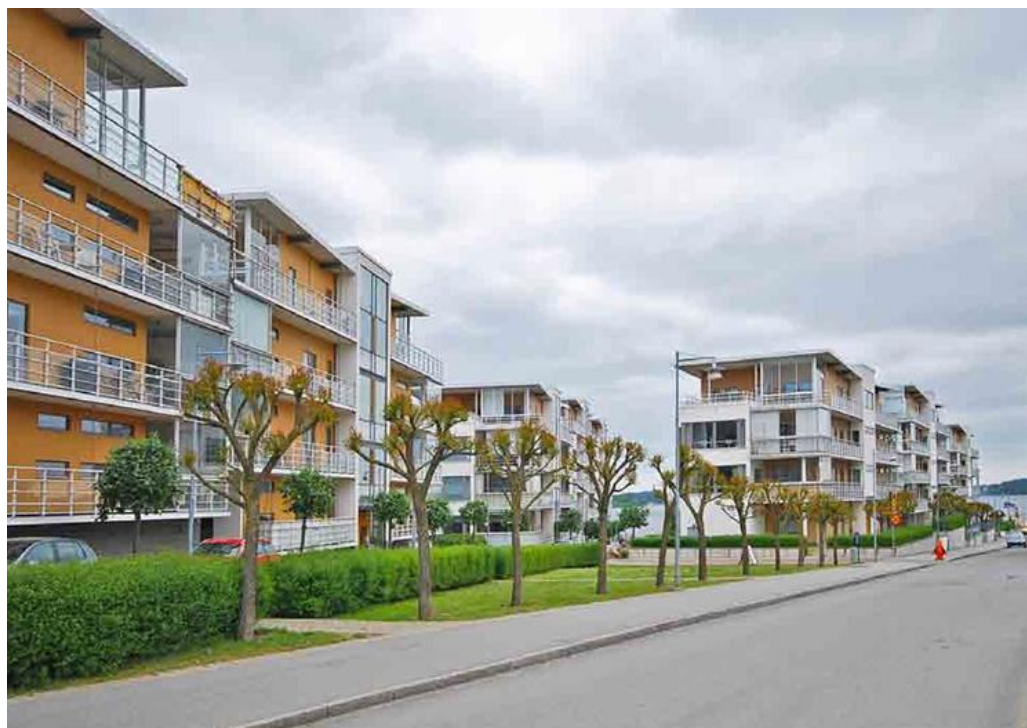
Gåshaga pirar uppfördes under den stora om- och nybyggnationen av Gåshaga åren 1999-2009.