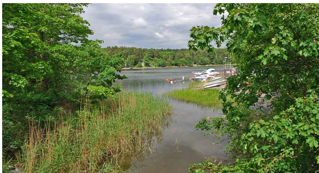
Ekholmsnäs sund avgränsar Killinge från Ekholmsnäs.

På sydöstra delen av Lidingö är skärgårdsterrängen påtaglig och bergknallarna en utpräglad del av landskapet. Samtliga tre stadsdelar, Gåshaga, Killinge och Käppala, har namn efter gårdar som alla är borta sedan länge.