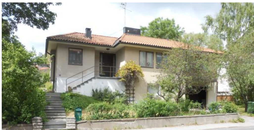
Villa i bungalow-liknande stil från 1957. Fältet 31. Arkitekt Sixten Magnusson.

Villabygget har fortsatt fram till idag och modernistiska tillägg har hållit hög kvalitet och varit representativa för sin tid. Inom kulturmiljön i villastaden finns det ett flertal representativa villor från denna period. Generellt har bebyggelsen i kärnområdet hög kvalitet vad gäller arkitektur, utförande och material.