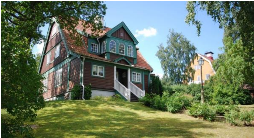
Villa från 1909 i nationalromantisk stil. Berget 3. Arkitekt okänd.