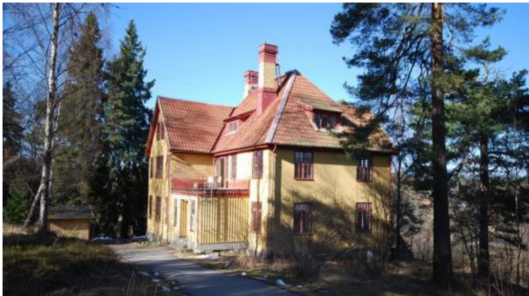
Villa från 1908 uppförd i stram jugend. Bokskogen 4. Arkitekter Dorph och Höög.

Från cirka 1910 skiftade stilen mot ett tydligt nationalromantiskt ideal med romantiserade bilder av det svenska agrarsamhället. Fasader är ofta putsade och ibland panelade, och det finns även villor med referenser till vasatidens borgarkitektur eller svensk timmerstuga. Taken är branta och sadeltak är vanligt. Fönstren har tätt sittande spröjsar och arkitekturen livas upp av fönsterluckor, loggior och burspråk.