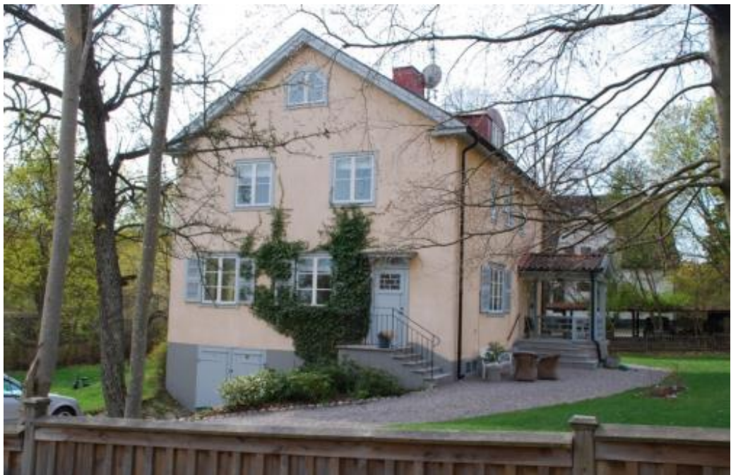
Villa från 1931 uppförd i klassicistisk stil, en stil som dröjde sig kvar in på 30-talet. Vallen östra 11. Arkitekt Einar Rudskog.

Under 1920-talet uppfördes villorna i en klassicerande form med inspiration från svenskt 1700-tal och svensk empir. Fasader var klädda med locklistpanel och ljusa kulörer, och dekorativa detaljer som hörnpilastrar, lunettfönster och festonger var vanliga. Taken var vanligtvis sadeltak men kunde också vara brutna och täckta med tegel. Fönstren var större än tidigare och hade tvåluftsfönster med tre rutor per båge i bottenplanet och två rutor per båge i övre planet.