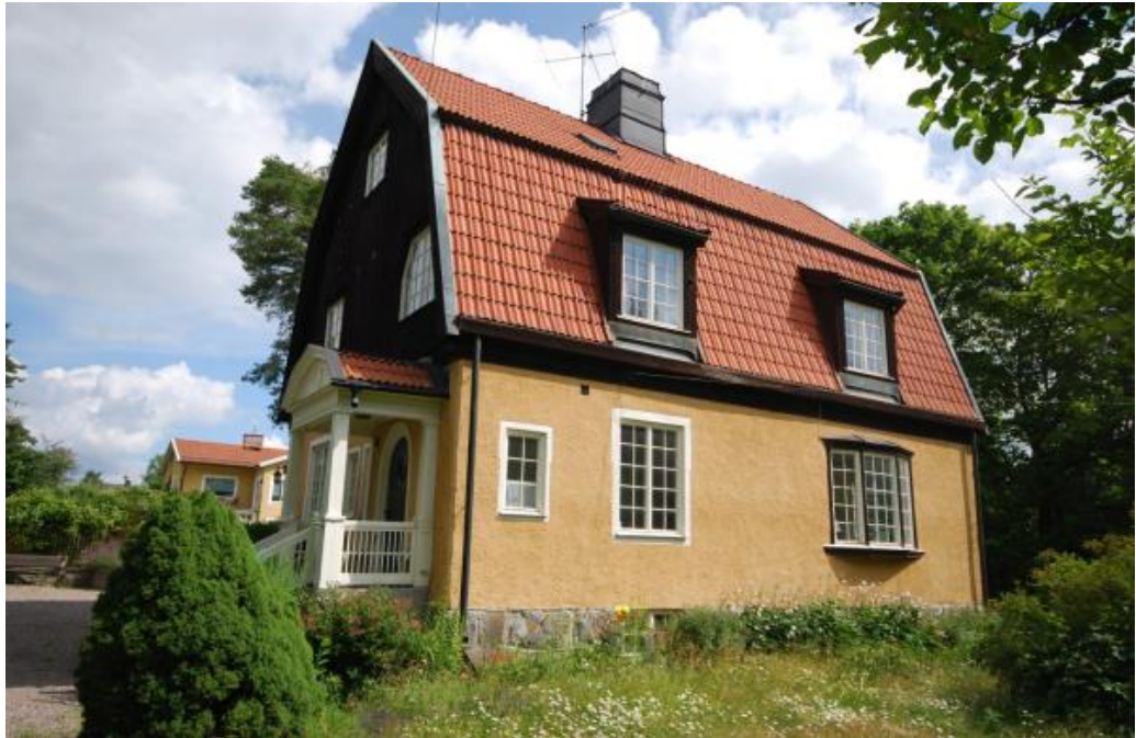
Villa från 1910 med drag av både jugend och nationalromantik. Fältet 29. Alf Landén.

Under 1920-talet uppfördes villorna i en klassicerande form med inspiration från svenskt 1700-tal och svensk empir. Fasader var klädda med locklistpanel och ljusa kulörer, och dekorativa detaljer som hörnpilastrar, lunettfönster och festonger var vanliga. Taken var vanligtvis sadeltak men kunde också vara brutna och täckta med tegel. Fönstren var större än tidigare och hade tvåluftsfönster med tre rutor per båge i bottenplanet och två rutor per båge i övre planet.