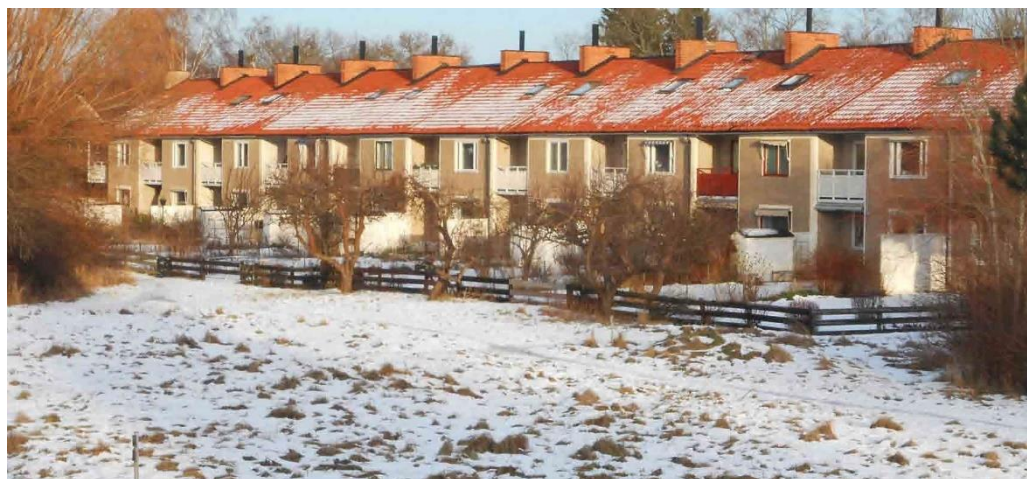
Hersby Gärde. Områdets mycket välbevarade, välplanerade grundstruktur från 1948-1950 framträder tydligt oavsett om det är vinter och avlövat eller sommar och grönska.