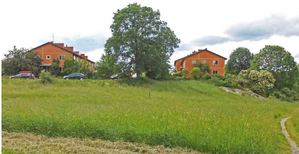
Bebyggelsen i Hersby Åker är placerad på en höjd i landskapet.