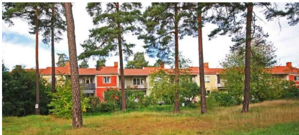
Vy mot Heimdal 1 från den lilla park som vetter mot kvarteret Tor i söder.