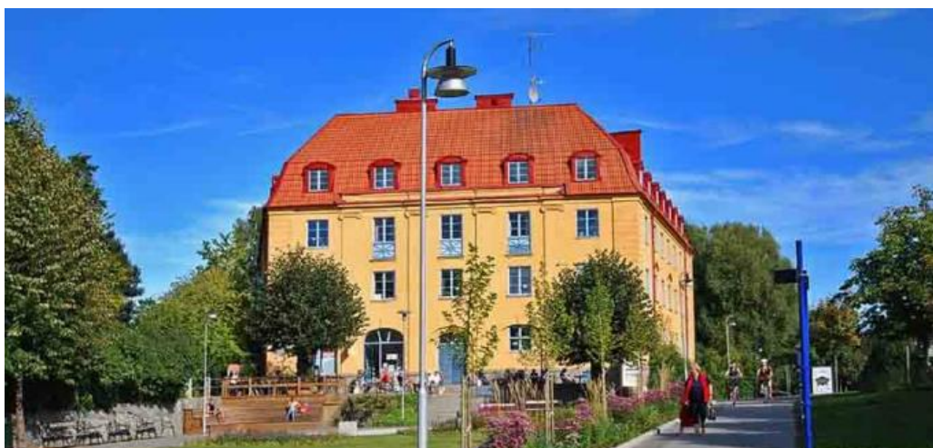
Köpmannen 1, kallat Vasaborgen ritades 1923 av Anton Wallby.

Lidingös kanske mest monumentala centrumbyggnad från den tidiga villastadsepoken, Vasaborgen, tillkom inte förrän 1923 med Anton Wallby som arkitekt, dock med Jacob J:son Gates ursprungsritningar från 1913 som grund. Exteriörens mäktiga massivitet anknäver till 1910-talets nationalromantik, men fasadens ljusa putsarkitektur präglas dock av 1920-talets klassicism. Vasaborgen inrymde bostäder samt i bottenvåningen affärslokaler.