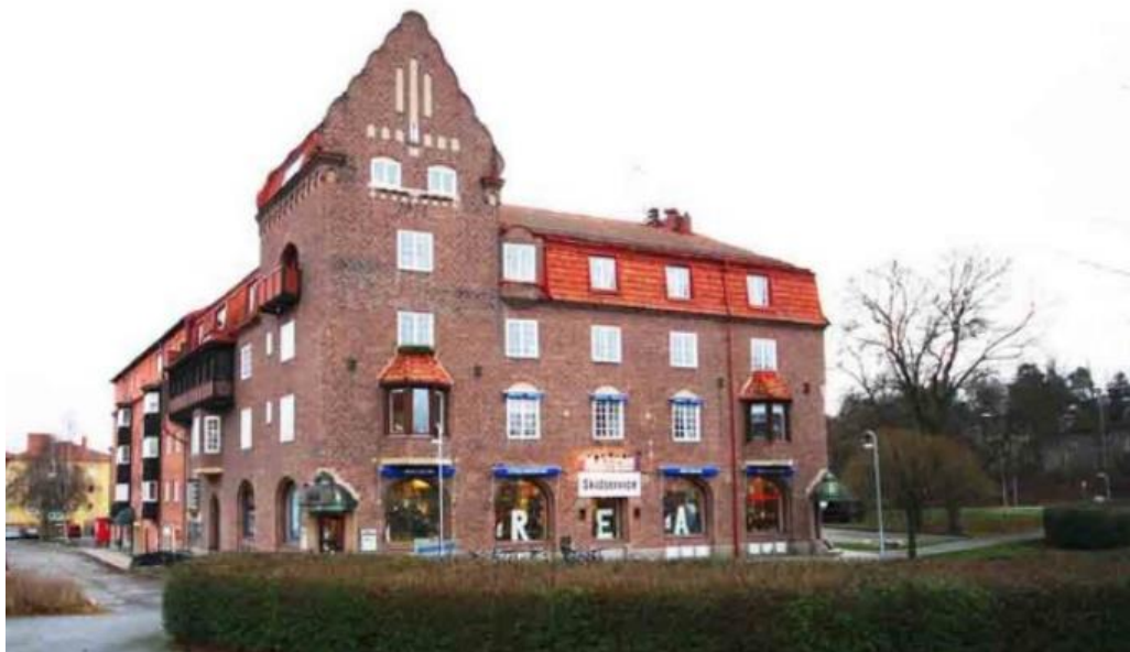
Vasa 1 Centralpalatset från 1913 är ritat av arkitekten Alf Landén

Av den stadsmässiga centrumbebyggelse med bostäder och affärslokaler som av allt att döma planerades för Lidingö under tidigt 1900-tal var det endast Centralpalatset och lite senare Vasaborgen som kom till utförande. Alf Landén var arkitekt till Centralpalatset 1913. Han skapade en nationalromantisk borgliknande centrumbyggnad i tegel. Centralpalatset har en tidstypiskt framhävd monumental placering i fonden av den tänkta centrumbildningen vid Lejonvägen /Vasavägen.