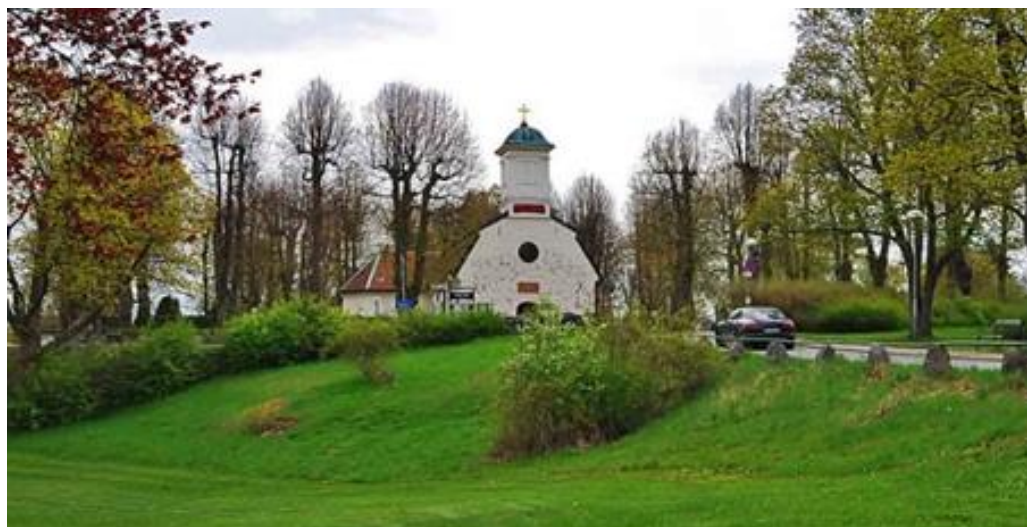
Lidingö kyrka uppfördes mellan åren 1617–1623.

Vid Stockholmsvägen, strax intill "Vasaborgen", ligger Vattängens gård, ett torp under Hersby, uppfört under 1840-talet. Inom Vallen Östra 9 finns en äldre byggnad som troligen också hört till Hersby gård, liksom en källarbyggnad inom Vallen Västra 5. Båda byggnaderna finns ännu kvar. Torpet inom Vallen Östra 9 kom senare att bebos av konstnären Siri Derkert.