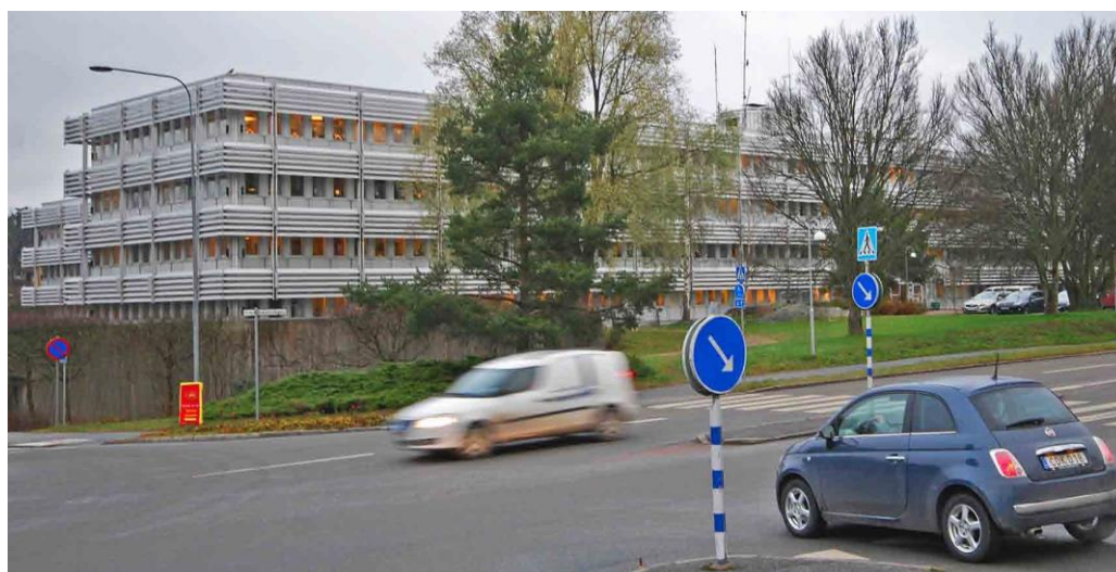
Stadshuset från 1970-talets början.

Stadshuset uppfördes 1974-1975 som ett resultat av två arkitekttävlingar, som båda togs hem av arkitekten Sten Samuelsson. Bygget föregicks av en lång planerings- och samhällsdebatt på Lidingö och den stora anläggning, som till slut uppfördes, utgör bara 1/3 av det ursprungliga förslaget. Detta omfattade även byggnader för handel och kultur. Upphovsman till stadshusets mycket medvetet gestaltade omgivning, inklusive de japaninspirerade trädgårdspartierna, är landskapsarkitekt Walter Bauer.