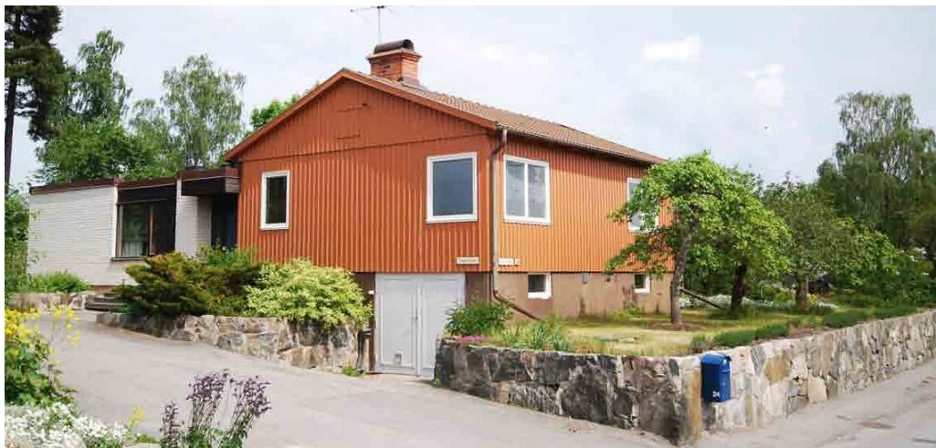
Tulpanen 7. Liten egnahemsvilla vars ursprungliga 1930-talsexteriör är väl bibehållen. 1968 gjordes en mindre tillbyggnad med fasad i vit kalksandsten.

Villorna ligger med långsidorna mot vägen förutom i kvarteret Hyacinten där villorna vänder ena gaveln utåt. De ligger på ett gemensamt avstånd, indragna från gatan med en liten förgårdsmark mellan fasad och gata. Gaturummet inramas av häckar, låga staket och några låga murar. Vägen är smal utan trottoarer. Villornas placering längs vägen med förgårdsmark och låga avgränsningar tydliggör gaturummet. Området har överlag en intim småstadskaraktär.