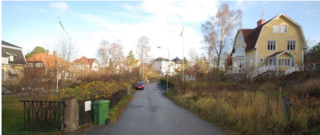
Albavägen mot öster.

Norra Islinge har en annan karaktär av villastad än området i söder. Först efter 1923 var avstyckningen igång norr om Norra Kungsvägen. Där bebyggdes ett stort område med villor med stildrag av 1920-tals klassicism och funktionalism under främst 1930- och 1940-talen. Den samlade karaktären av villastad på ofta stora tomter i den kuperade terrängen är fortfarande väl bibehållen.