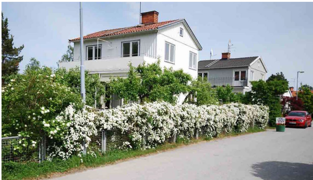
Egnahemsvillorna från 1930-talet längs med Krokusvägen.

På sent 1930-tal bebyggdes småstugeområdet kring Krokusvägen på Islingeplatån. Området är ett fint exempel på ett enhetligt planerat och väl sammanhållet område med egnahemsvillor från sent 1930-tal.