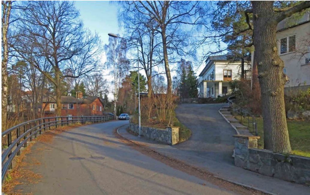
Constantiavägen vid kvarteret Rösset.

Vegetationen är rik och varierad, höga furor och lövträd står kvar i enklaver kring små bergknallar och ger även stark karaktär åt de naturpräglade villatomterna. Bebyggelsemönstret präglas av villornas regelbundna placering längs vägarna i indraget läge på tomten. På grund av terrängens växlingar och nivåskillnader upplevs bebyggelsemönstret som varierat även om det egentligen är rationellt regelbundet.