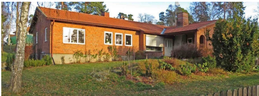
Högplatån 40 ritad av Lennart Erksammar 1949, utförd i tegel med vinkelbyggd huskropp.

I området finns även exempel på villor från övergången 1940–1950-tal där efterkrigstidens modernism slår igenom. Ofta är det enplansvillor med tegelfasader under tegeltäckta flacka sadeltak, ibland med vinkelbyggda eller sidförskjutna byggnadskroppar. Inte sällan finns drag av ett klassicerande formspråk i detaljer som portalomfattningar, gesimser och små frontoner. Exempelvis kan nämnas villorna på Högplatån 38, 39 och 40 från 1949.