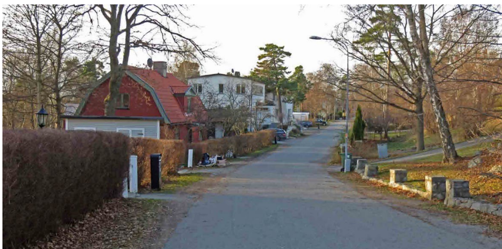
Constantiavägen mot väster.

Redan tidigt fanns ett förslag till plan för Islinge Villastad på höjden i norra Islinge. Exploatören Carl Gustav Dahlerus bortgång 1910 samt en ekonomisk recession under första världskriget och 1920-talet resulterade i att området inte började bebyggas förrän på 1930-talet. Den stadsplan som vann laga kraft 1933 har stora likheter med förslaget för Islinge villastad från 1907. Planen är tydligt anpassad till topografin.