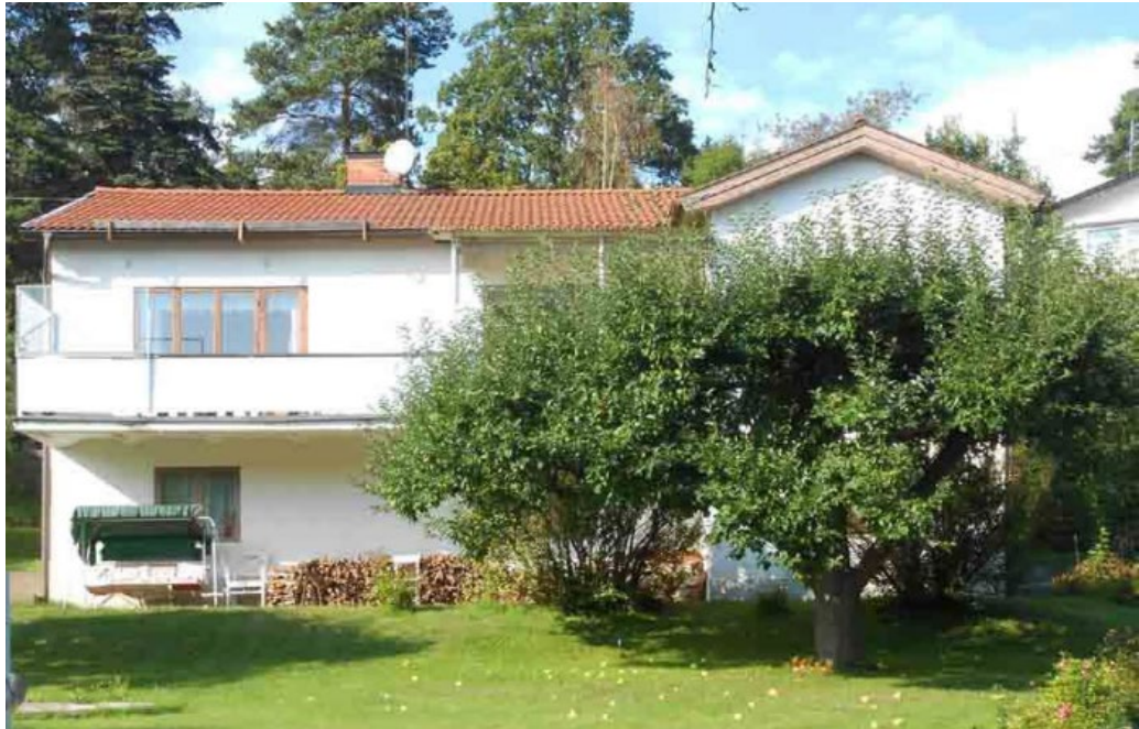
Solsidan 10 är ett BORO-hus uppförd 1935.

Även den så kallade småstugan förekommer i norra Islinge även om den framför allt kom att sätta prägel på Krokusvägen. Det är småskaliga rationellt utformade egnahemsvillor med rektangulär plan. Fasaderna är klädda med ljusmålad locklistpanel och saknar knutbräder. De flacka sadeltaken är täckta med lertegel och har taksprång på synliga tassar. Fönstren ligger i fasadliv, har helglasade fönsterbågar och mycket smala omfattningar. Planlösningarna är rationella, väl genomtänkta och ekonomiska.