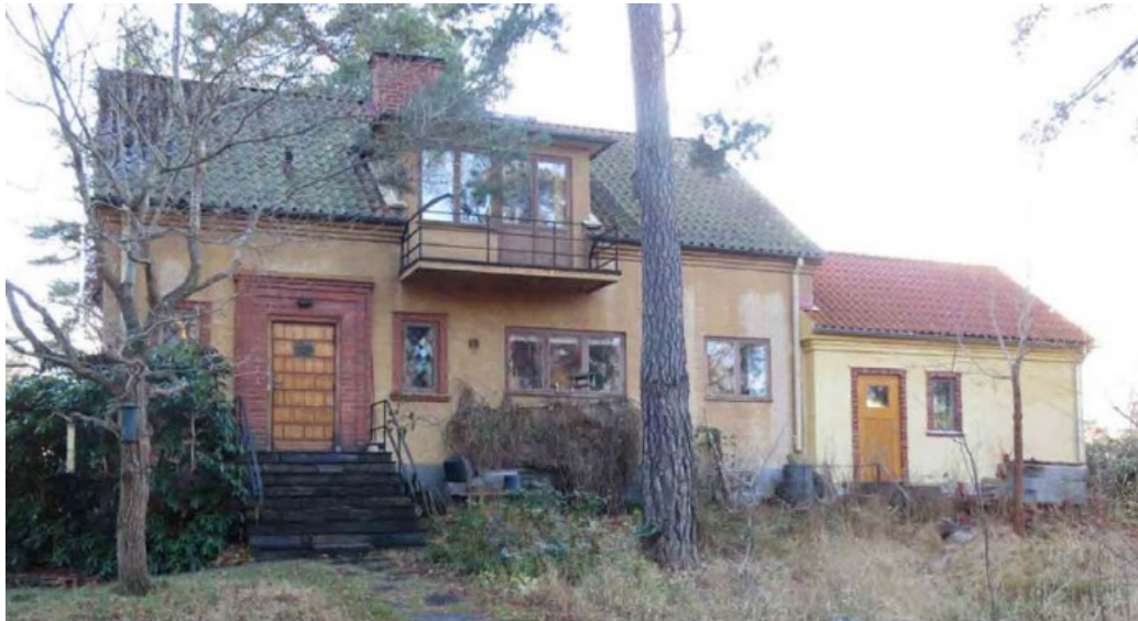
Åsen 9 ritad av Einar Rudskog 1939.

I norra Islinge finns ett fåtal villor som tillhör den första, mer internationellt baserade funktionalism som slår igenom på 1930-talet. "Form follows function" är funktisstilens stora grundidé, det vill säga att husets arkitektoniska utformning ska återspegla rumsfunktionerna rationellt och funktionellt, i samklang med optimal ljus och luftväxling. Luftiga volymer, ofta ljusa putsfasader, uppglasade hörnpartier och ett avancerat arkitektoniskt formspråk är några utmärkande drag. En av Lidingös