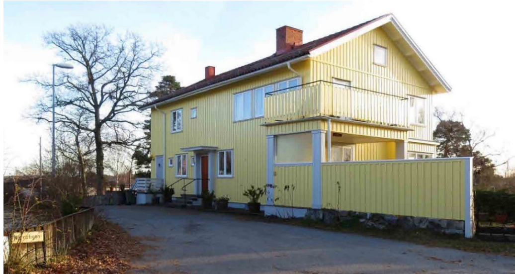
Solsidan 16 med sin sakligt rationella funktionspräglade träarkitektur. Villan ritades av John Åkerlund 1930.

mest utpräglad rationellt funktionalistiska villor är Solsidan 16, ritad av John Åkerlund så tidigt som 1930.