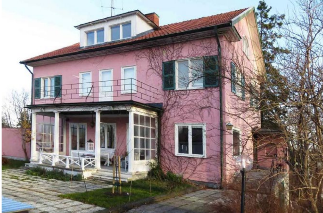
Hjässan 9 ritad av Einar Rudskog 1935.

materialkänsla med strävan efter goda material. Några utmärkta exempel på Einar Rudskogs villor inom området är Hjässan 9 och Åsen 19.