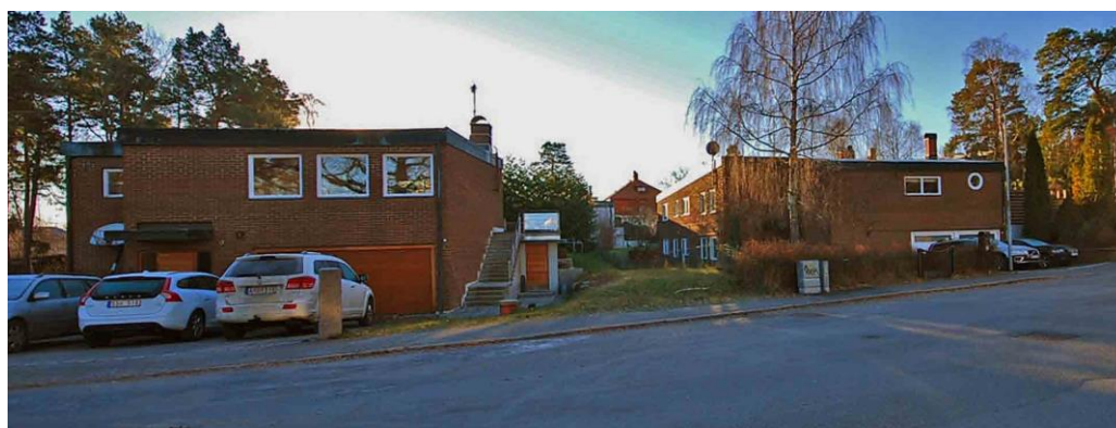
Tjärblomstret 1 och 2 ritades av arkitekten Peter Diebitsch 1962.

Tjärblomstrets villor ligger delvis i souterräng, har garage och förråd i bottenvåningen och en tvådelad vinklad huskropp med fasad i hårdbränt brunrött tegel. De har sinsemellan en likartad utformning. Byggnadernas likhet med bebyggelsen i Misteln är att de är uppförda i två våningar under papptäckt platt tak, gavelplacerad skorsten, samt mycket tidstypiska fönsterformer och entréer. Detaljer som bred taklist i koppar, småfönster, utanpåliggande trappor och de elegant utformade entréerna i något ljusare trä till bostad och garage knyter an till den tydliga prägel av arkitekturade villor.