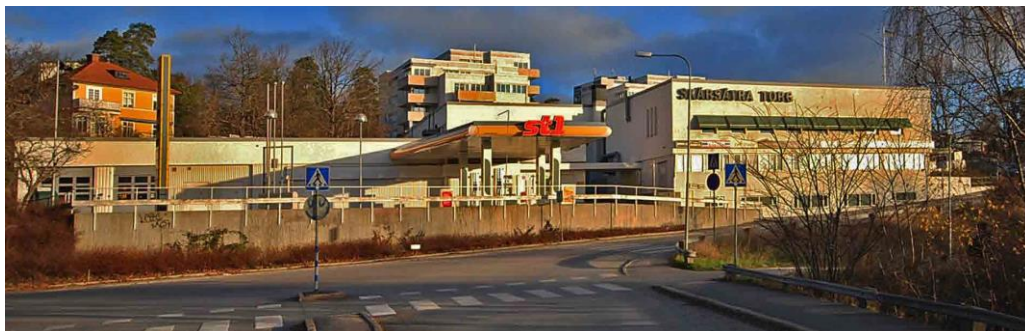
Skärsätra centrum från 1971–1972, vy från söder.