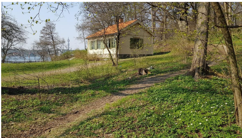
Larsbergs Brostuga ligger invid Larsbergs brygga.