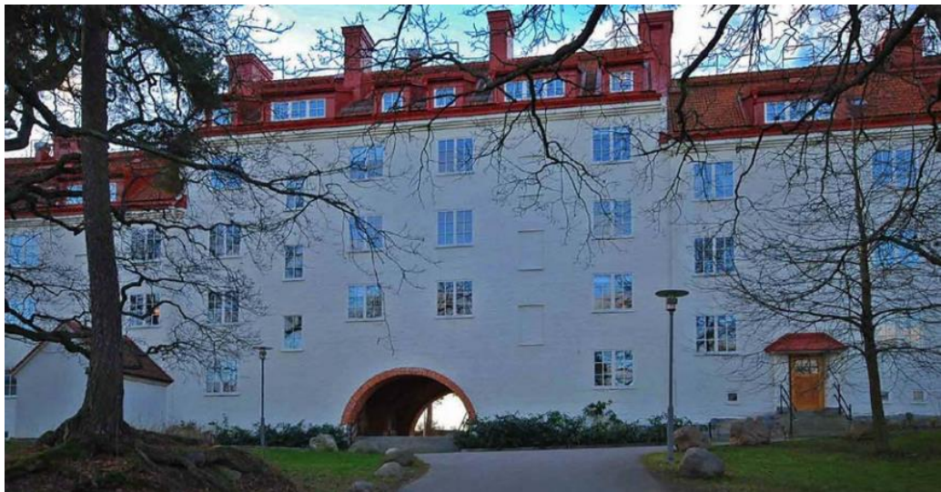
Mittvägshuset från 1914 är en av Lidingös kulturhistoriska karaktärsbyggnader.

Kärnan i Bergsättra består av det monumentala långsträckt bostadshus med arbetarbostäder till AGA som Fastighets AB Bergsättra lät bygga 1914. Arkitekten Erik Hahr gav huset en dominerande placering på bergsryggen och en påtaglig nationalromantisk stram utformning. Den stora volymen med putsad fasad, tegelvälvd passage, spröjsade fönster, höga tegeltak och entréer i rad sätter fortfarande en stark prägel på området. Efter 2000-talets förtätningar med stora flerbostadshus i omgivningen har den mäktiga upplevelsen av det stora Bergsättrahuset minskats, men har ändå fortfarande en central betydelse i helhetsmiljön (Stensötan 1).