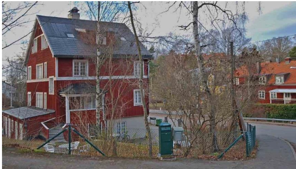
Sveavägen mellan kvarteren Linnean och Vitmossan.

Det sena 1940-talets expansion i området resulterade i totalt fem flerbostadshus i kvarteren Harsyran och Stensötan (Stensötan 6 samt Lidingö 10:482 och 10:485), bland bergknallarna nordväst och öster om det ursprungliga Bergsätrahuset. Husen har i hög grad bevarat en ursprunglig exteriör. Harsyran 14 är ett av Lidingös större flerbostadshus från 1940-talet. Stram volym, valmtak, ljusputsad fasad, tidstypiskt utformade 1940-talsentréer och flera andra fasaddetaljer i original ger stark karaktär åt kulturmiljön. Samma gäller den enhetliga, mycket väl utformade och landskapsanpassade husgruppen i Stensötan 6 samt Lidingö 10:482 och 10:485, med trevånings lamellhus i nyansrikt rött tegel. Även här finns ett mycket välbevarat samspel mellan husplacering, helhetsintryck och originaldetaljer som spelar en central roll för upplevelsen av den värdefulla kulturmiljön i Bergsätra.