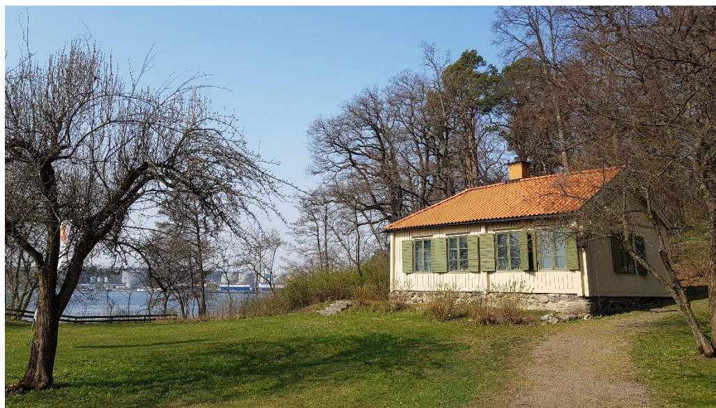
Larsbergs brostuga ligger intill Larsbergs brygga.