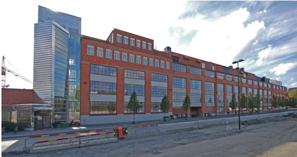
Byggnaderna 113, 112 och 111, de gamla verkstadsblocken III-I, efter om- och tillbyggnad.

Ett av blocken har fått en ny hög tillbyggnad i glas och reflekterande plåt. Byggnad 105 uppfördes 1934, anpassad till de äldre tegelblocken. Den nationalromantiska byggnaden 102, i nordväst, uppfördes 1912 bland annat som portvaktsbyggnad och är en av områdets verkliga karaktärsbyggnader. Byggnad 103 uppfördes som transformatorstation i 1920-talsklassicism 1930. Byggnad 104 byggdes som arbetarmatsal och kök 1914 och i ena hörnet tillkom en vaktkur under 1960-talet.