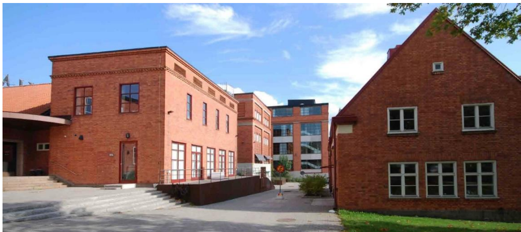
Hus 103, f.d. transformatorstationen från 1930, hus 105 från 1935 och hus 102 portvaktsbyggnad från 1912.

Ett av blocken har fått en ny hög tillbyggnad i glas och reflekterande plåt. Byggnad 105 uppfördes 1934, anpassad till de äldre tegelblocken. Den nationalromantiska byggnaden 102, i nordväst, uppfördes 1912 bland annat som portvaktsbyggnad och är en av områdets verkliga karaktärsbyggnader. Byggnad 103 uppfördes som transformatorstation i 1920-talsklassicism 1930. Byggnad 104 byggdes som arbetarmatsal och kök 1914 och i ena hörnet tillkom en vaktkur under 1960-talet.