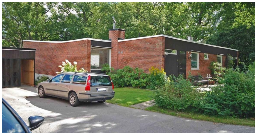
Projektorns fyra modernistiska villor ritades 1958 av arkitekterna Gustaf Lettström och Fritz Jaenecke/Sten Samuelson. Villornas omsorgsfullt utformade exteriörer är karaktäristiska för sent 1950-tal.

Kvarteret Projektorn närmast Kottlasjön omfattar fyra identiska villor uppförda 1959 i ett plan utan källare. Husen har L-formad plan, stomme i lättbetong samt fasader i rött tegel, vit puts och smal stående mörkbrun träpanel. En smal plåtsarg löper som taklist. Träfönstren har varierande utformning typisk för sent 1950-tal. Husen täcks av ett flackt pulpettak med motfallstak över vinkelbyggnaden samt skorsten i rött tegel.