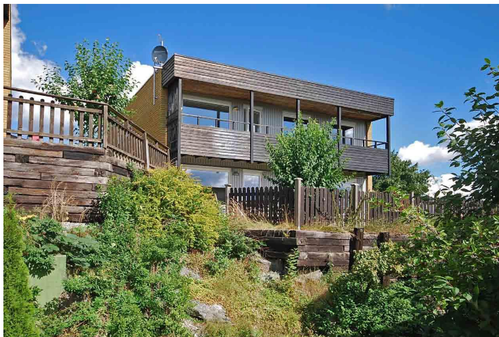
Förstärkarens ena långsida med indragna balkonger och balkongparti med bred taksarg i mörkbrun träpanel.