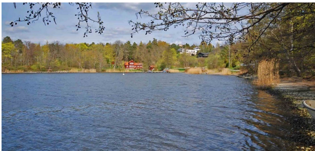
Vy över Rödstuguviken in mot Rödstugan 1, på 1500-1700-talet den centrala platsen för överfart från Lidingö mot Djursholms gods på fastlandet.

I det vidsträckta Norra Sticklinge fanns länge endast enstaka bebyggelse i form av småjordbruk, torp och fiskarstugor, exempelvis vid Kyttinge, Rödstugan och Sättinge. Vid Färjartorpet i Rödstuguviken i nordväst låg under flera hundra år det centrala färjeläget för överskeppning mot fastlandet och det stora Djursholmsgodset.