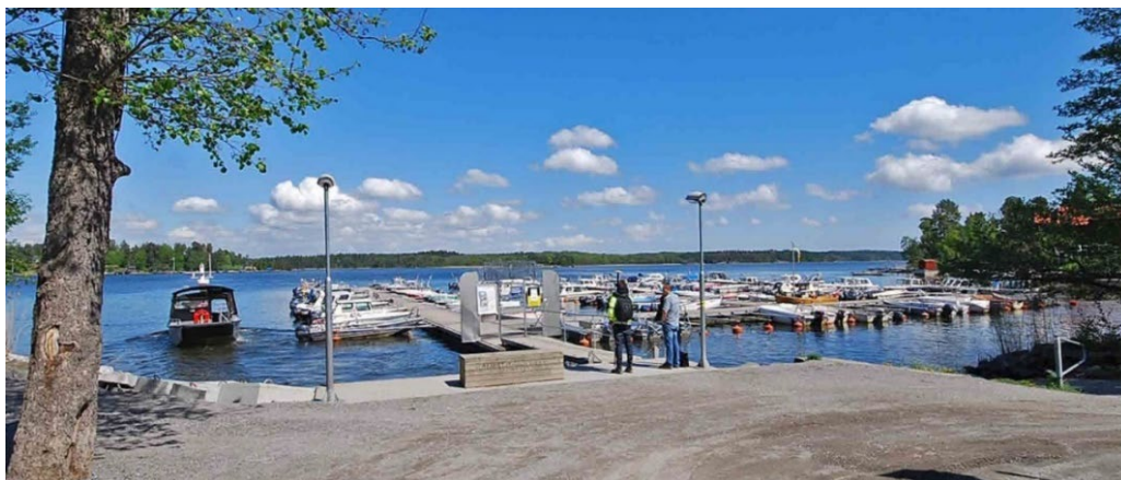
Mor Annas brygga nära Sättinge i norr, med parkering för invånarna ute på Storholmen, är i dag Norra Sticklinges stora maritima knutpunkt.

Efter att Lidingön friköpts från Djursholm 1774 och fått sin första broförbindelse 1803 (vid Larsberg) minskade färjelägets betydelse. På 1860-talet tillkom enstaka sommarvillor vid Sättsjö och Sättinge i norr, där det sedan tidigare fanns äldre bebyggelse. Vid Sättsjö fanns tegelbruk på 1700-talet och på 1870-talet ångbåtsbrygga. I dag är det framför allt Mor Annas brygga nära Sättinge, med parkering för invånarna ute på Storholmen, som är Sticklinges stora maritima knutpunkt.