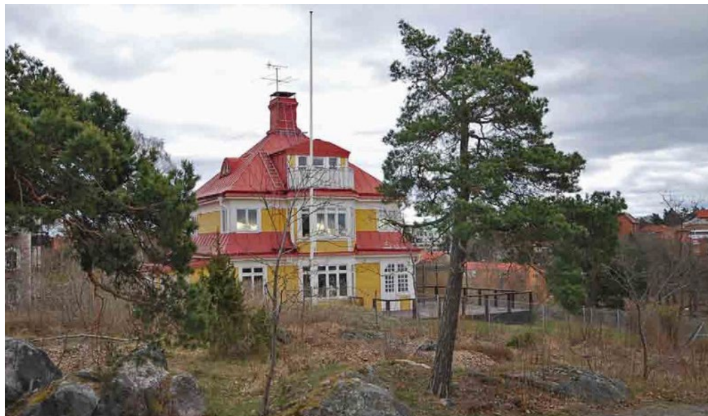
F.d. Ihrefeldtska barnhemmet, från ca 1900, en rest av sommarvillabebyggelsen på Torsviksbranten. (Brofästet 6)

1943 års förslag till dispositionsplan för Lidingö resulterade i tillkomsten av stadens första moderna flerbostadsområde uppe på Torsvikshöjden, påbörjat 1943. Som en följd av stadsplanen bebyggdes samtliga kvarter närmast norr om Stockholmsvägen med flerbostadshus i tre-fyra våningar mellan 1944 och 1950. Det är den bebyggelse som i dag kännetecknar Torsvik och som sträcker sig längs Stockholmsvägens norrsida till Lidingö centrum.