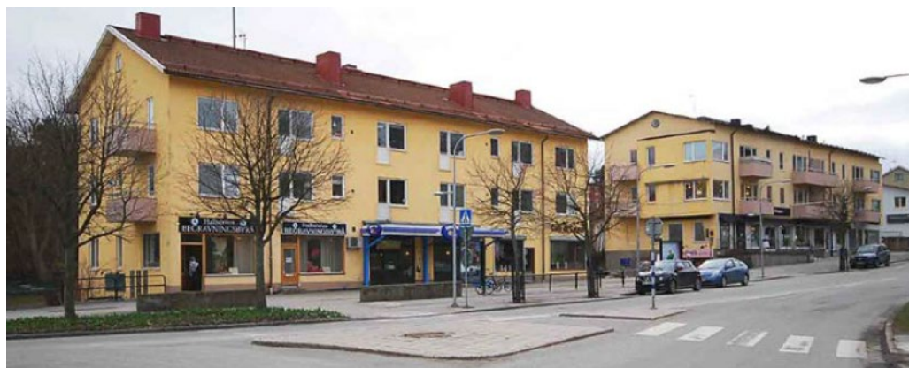
Kring Stockholmsvägen etablerades en centrummiljö under 1930-1950-talen.

Torsviks sydligaste del mot Stockholmsvägen präglades tidigt av den centrumbildning som uppstod i början av 1900-talet kring Torsvikstorg och Stockholmsvägen. I området uppfördes även Torsviks skola, vars äldsta byggnad är från 1906. Längs med Stockholmsvägen finns små bostads- och affärshus som enda återstoden av den centrummiljö som präglade Lidingö på 1930-1950-talen. I Torsvik finns även flera flerbostadshus som är utmärkta exempel på folkhemsbebyggelse från 1940-talets efterkrigstid, som på tex Siggebovägen och Skolvägen.