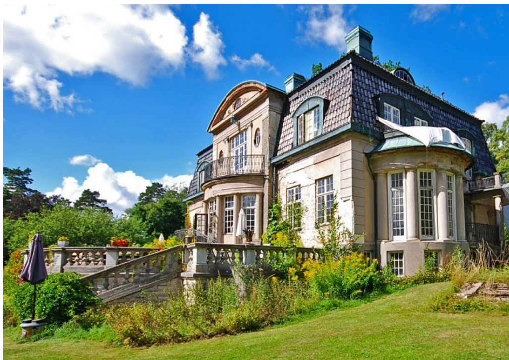
Villa Kassman på Storholmen.

På övriga öar och holmar kring Lidingö byggdes mer enstaka sportstugor under åren 1925–1940. Framför allt efter 1945 växte fritidshusen mer allmänt i antal på öar och holmar. Även en del mycket små holmar försågs med ett fritidshus fram till att strandskyddet utvecklades.