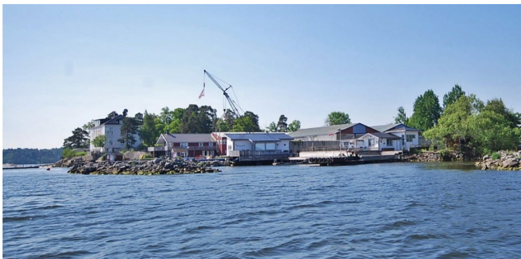
Duvholmen. Vy mot Duvholmens varv och den stora vita sommarvillan från 1890-talet.

På Storholmen fanns ett dagsverkstorp under Frösviks säteri från 1780-talet och framåt. I övrigt var det Stora Fjäderholmen och Stora Höggarn som hade en fast bosättning.