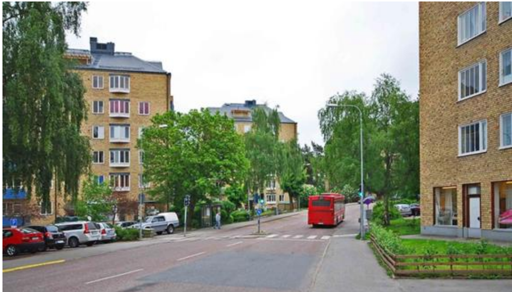
De gula höga punkthusen är ett mycket karaktärsfullt inslag kring Bodalsvägen i området Baggeby.

År 1985 byggdes en kombinerad anläggning för bostäder, äldreboende och förskola som fick namnet Baggeby gård. En viss förtätning med nya flerbostadshus gjordes i Bodal 2007. Bodals gård i tillbyggt skick inrymmer numera lokaler för Linköpings universitet med Carl Malmsten Furniture Studies.