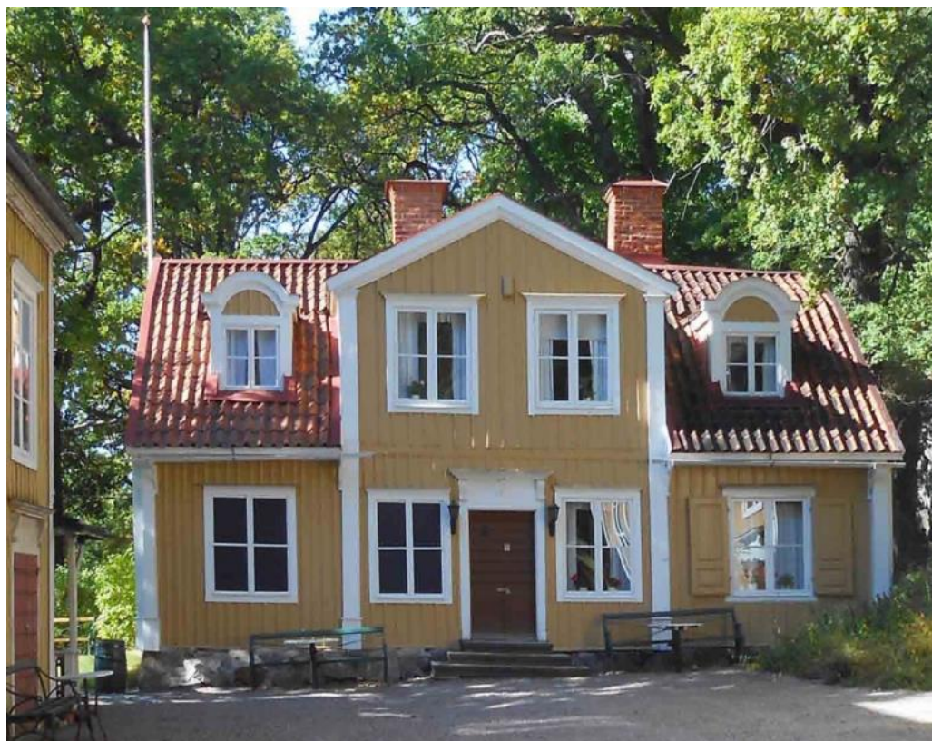
Lidingsbergs gårdsmiljö betraktas i sin helhet som byggnadsminne sedan 1942.

Strax nedanför Lidingsberg ligger det lilla torpet Öskure. Huset har namn efter en "Ödeskure" backstuga som låg där Lidingsberg byggdes 1775. På platsen för torpet fanns då en bagarstuga vars källare senare överbyggdes med nuvarande timrade bostadshus 1846.