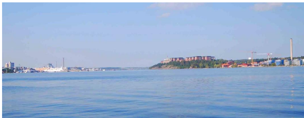
Flerbostadshusen i Larsberg syns tydligt på håll sett från Ängsholmen, Fjäderholmarna.

Stadsdelen Larsberg bebyggdes som ett stort flerbostadsområde åren 1965–1973 med John Mattson Fastighets AB som byggherre. Redan 1969 hade Larsberg 1200 lägenheter och ett centrum med detaljhandel, skola och andra samhällsfunktioner. På 1970-talet tillkom flerbostadshusen på Ekbacken längst i söder och 1984–1985 byggdes Larsbergs centrum ut med ett nytt centrumhus i kvarteret Klockbojen. 2006 om- och påbyggdes garagebyggnader med flerbostadshus nära centrum.