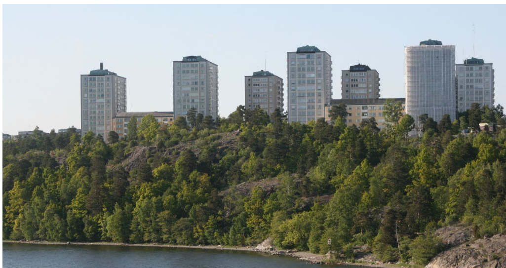
Vy från vattnet mot kvarteren Briggen, Fregatten och Roslagsskutan som ligger i området Bodal.