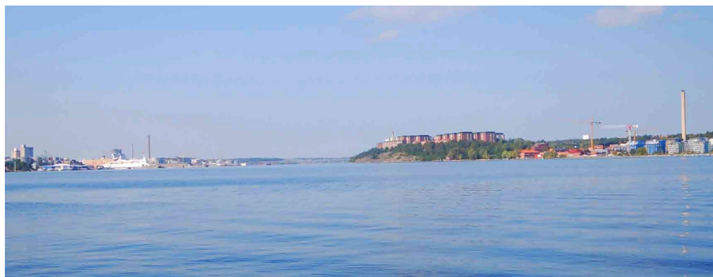
Flerbostadshuset i Larsberg syns tydligt på håll sett från Ängsholmen, Fjäderholmarna.

Stadsdelen Larsberg bebyggdes som ett stort flerbostadsområde åren 1965–1973 med John Mattson Fastighets AB som byggherre. Redan 1969 hade Larsberg 1200 lägenheter och ett centrum med detaljhandel, skola och andra samhällsfunktioner. På 1970-talet tillkom flerbostadshuset på Ekbacken längst i söder och 1984–1985 byggdes Larsbergs centrum ut med ett nytt centrumhus i kvarteret Klockbojen. 2006 om- och påbyggdes garagebyggnader med flerbostadshus nära centrum.