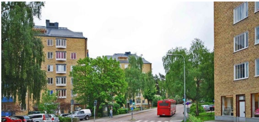
De gula höga punkthusen är ett mycket karaktärsfullt inslag kring Bodalsvägen i området Baggeby.

År 1985 byggdes en kombinerad anläggning för bostäder, äldreboende och förskola som fick namnet Baggeby gård. En viss förtätning med nya flerbostadshus gjordes i Bodal 2007. Bodals gård i tillbyggt skick inrymmer numera lokaler för Linköpings universitet med Carl Malmsten Furniture Studies.