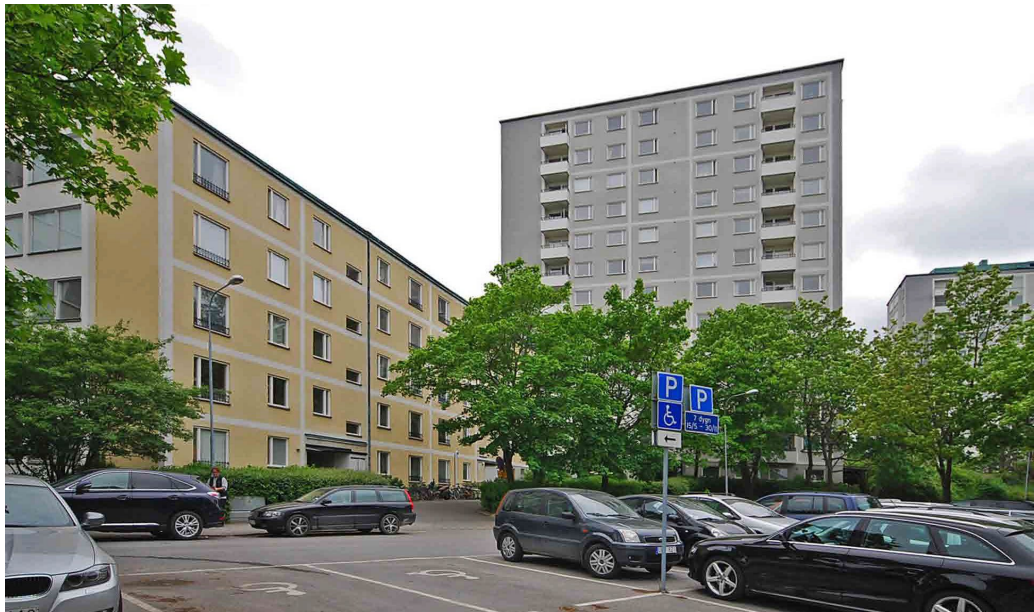
Briggen 1 och 2. Punkthus och lamellhus uppförda 1958–1962.

Fasaderna är putsade ljus grå och gult med vita fältindelningar. Fönstren är genomgående generösa med en- två- och tre lufter. På lamellhusen gavlar är fönstren samlade vertikalt i ett svagt utskjutande fasadparti. Fasaderna livas av delvis indragna balkonger. Lamellhusen kännetecknas av asymmetriska sadeltak och punkthusen av mer eller mindre förhöjda plantak med kopparplåt.