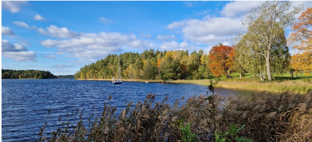
Södergarnsviken vid Södergarn.

Handelsbanken hyrde 1929 Södergarn för att erbjuda sin personal ett rekreations- och semesterhem i lantlig miljö och så småningom köpte Handelsbanken hela fastigheten. 1962 lät Handelsbanken uppföra en kursgård varvid den gamla gårdsbebyggelsen från 1700-talet revs. Handelsbankens nya kursgård ritades av arkitekten Lars Åkerlund. Landskapsarkitekt Walter Bauer utformade den omgivande parken med utgångspunkt från den äldre landskapsstrukturen.