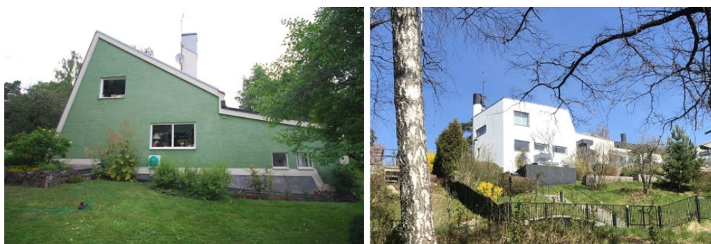
Villa Molin till vänster och Villa Gadelius till höger, båda ritade av Ralph Erskine.

Rudboda var fortfarande långt in på 1900-talet en utpräglad landsbygd dominerad av jordbruk och fiske. Järnåldersgravar omger ödegården Sundby vid Kyrkviken som har förhistoriskt ursprung. Rudboda gård har ursprung från medeltiden. På Hustegaholm fanns en liten vaxljusfabrik under sent 1800-tal. Vid sekelskiftet tillkom några sommarvillor nära Kyrkviken och några enstaka egnahem uppfördes där på 1930- och 40-talet. Under 1900-talets senare del byggdes i samma område några för sin tid avancerade modernistiska villor. Villa Molin från 1947 och Villa Gadelius från 1961 har båda Ralph Erskine (1914–2005) som arkitekt och tillhör numera svensk arkitekturhistoria.