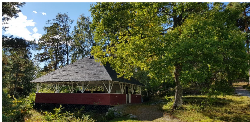
Dansbanan i skogskanten uppfördes på 1930-talet och renoverades på 1990-talet.

Huvudentrén till kolonin är i söder och markeras av en träportal märkt "Dalaföreningen". Ett stycke innanför entrén vidtar ett stort öppet gräsbevuxet område som kallas Lekvallen. Här finns bystuga, dansbana och grupper av fruktträd. Fruktträden återspeglar den stora betydelse som tillgången på egen frukt stod för på 1920-1940-talet. Områdets stora gräsbevuxna ytor vittnar om den f.d. potatisodlingens viktiga funktion i äldre dagar.