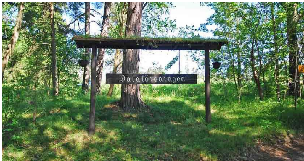
Dalakolonin. Entrén till området.