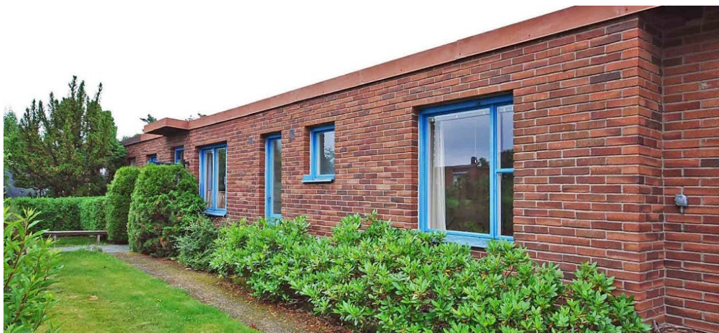
Kvarteret Yxans låga kedjehus.

Kvarteret Yxan karaktäriseras av låga kedjehus och radhus i souterräng. Överbyggda garage och förråd länkar samman husen. Samtliga hus har flacka pulpettak och många bevarar karaktäristiska fönster med sidospröjs liksom ursprungliga trädörrar med panel och glasruta. Tomtkarakteren kan ofta bli mer sluten mot gatan i kvarteret Yxan på grund av husens låga volym samt uppvuxna buskage och häckar.