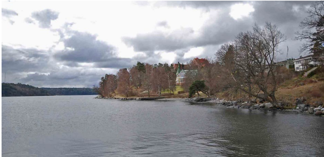
Vy från Halvkakssundet upp mot Villa Högudden och Högberga gård.