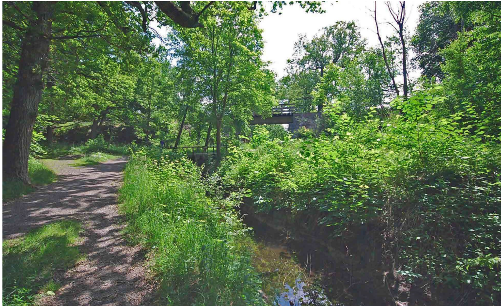
Mölnaåns dalgång vid Mölna tågbro.

Mölnavägen med omgivande kvarter var ett av de första områdena med mer utpräglat exklusiv modernistisk villabebyggelse i naturskön miljö som tog form på Lidingö under 1950-talet.