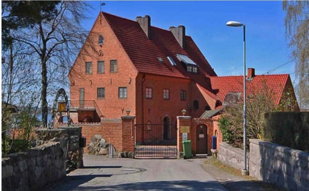
Villa Roskull från 1912 är ritat av arkitekt Sigurd Lewerentz som utformade Skogskyrkogården tillsammans med arkitekt Gunnar Asplund.

Frånsett de små flerbostadsområdena blev Brevik även fortsättningsvis ett utpräglat villasamhälle. Den ursprungliga inriktningen mot en villastad för ett övre samhällsskikt kom i och med 1920-talets inriktning på egna hem och småhus att bli betydligt mer varierad. Många arbetare och tjänstemän vid AGA var bosatta i Brevik. AGA satsade på småhus för anställda i kvarteret Bergryggen vid Saltsjövägen i sydväst, där bla flera typhus från Mockfjärd AB uppfördes åren 1957–1958.