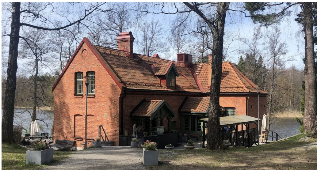
Vattenverket vid Kottlasjön uppfördes 1910 och den tidstypiska industriarkitekturen är fortfarande påtaglig. Idag används Vattenverket som café.