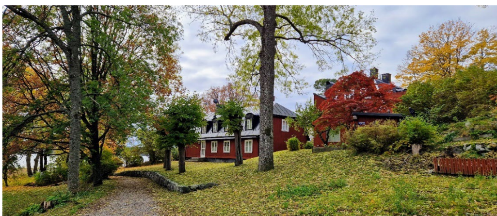
Mölna gård sedd från nordost.

I det småskaliga Mölna förenas natur- och kulturvärden i en stark helhetsupplevelse i en av Lidingös verkliga karaktärsmiljöer. Här finns stora jordbrukshistoriska värden i kulturlandskapet kring Mölna gamla kvarngård och även i själva Mölna gårdsmiljö. Av industrihistorisk betydelse är kvarnindustrins lämningar i Mölnaåns dalgång. Här finns även stora beröringspunkter med naturvärden främst längs dalgången upp mot Kottlasjön. Av kommunikationshistoriskt värde är även Mölna gårds brygga med stark förankring i den lilla sjöfarten längs segelleden.