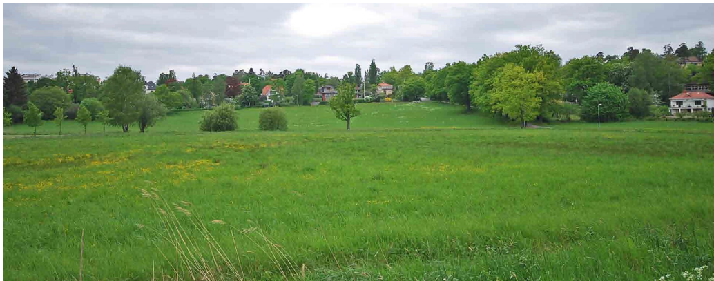
Breviks villastad, vy nerifrån hamnen över Breviks ängar norrut upp mot villorna vid Trädgårdsvägen.

Villastadens kärna ligger i den småkuperade sluttning som övergår i ett flackare dalstråk med karaktär av gammal sjöbotten mot hamnen vid Halvkaksundet. I dalsluttningen breder fortfarande Breviks ängar ut sig med öppna gräsbevuxna fält som ger stark karaktär åt den samlade villastaden högre upp i sluttningen. Smala raka gator löper ner över den branta sluttningen och inramar mer eller mindre rektangulära kvarter av olika storlekar.