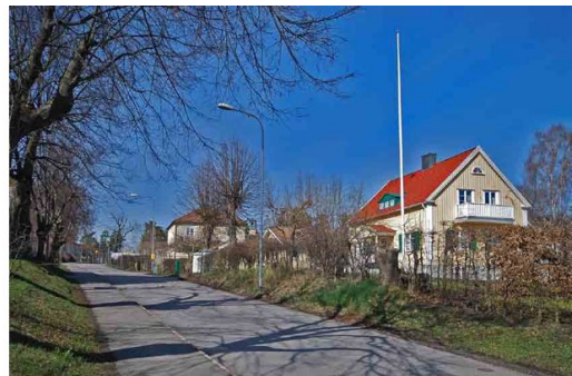
Västra Allén nere vid Breviks ängar (till vänster). Hövdingevägen vid Linet 14 som är en av villastadens egnaemspräglade 1920-talsvillor (till höger).

Flera villor bevarar en ursprunglig exteriör medan vissa blivit mer förändrade under 1900-talets gång. Villorna ligger generellt indragna från gatan och de äldre är uppförda i 1 ½-2 våningar. Här dominerar släta putsfasader eller panelarkitektur under branta sadeltak oftast belagda med tegel, skiffer eller plåt. Utformningen av detaljer som till exempel entrépartier, frontespiser, burspråk, verandor och takkupor varierar beroende på stiluttryck.