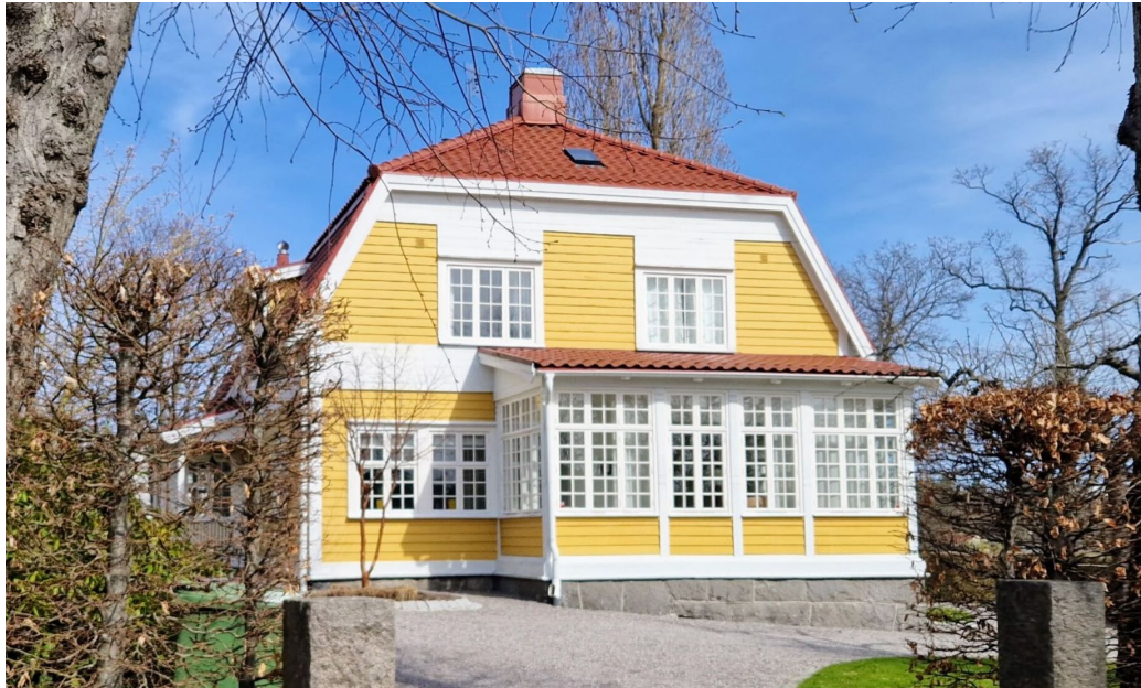
Linet 6 från 1909 vid Hövdingevägen.

Linet 12 och Rågen 12 har en för Lidingö karaktäristisk 1910-talsarkitektur. Den nationalromantiskt tjärbruna Vetet 8 har en säregen bakgrund, från början uppförd som experimentverkstad för Ljungströms Ångturbiner AB, men tidigt inredd till villa. Mer egnaemspräglade enklare utformade villor från 1910–1920-talet är Kornet 2 och Linet 14. I Rågen 3 från tidigt 1920-tal möts drag från både 1920-talsklassicism och funkisstil.