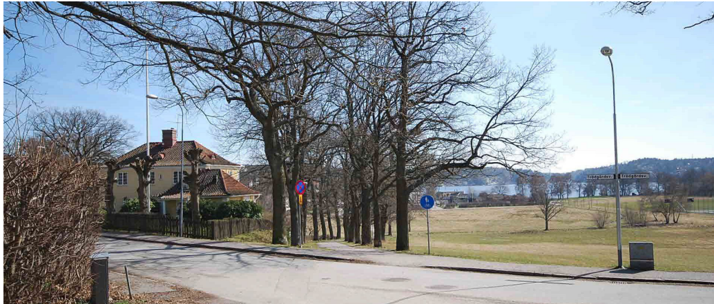
Östra Allén söderut från Havren 8 vid Trädgårdsvägen.