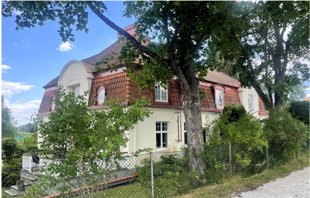
Parvillan inom Trädgården 10-11, en av två parvillor från 1912 som ligger bredvid varandra.