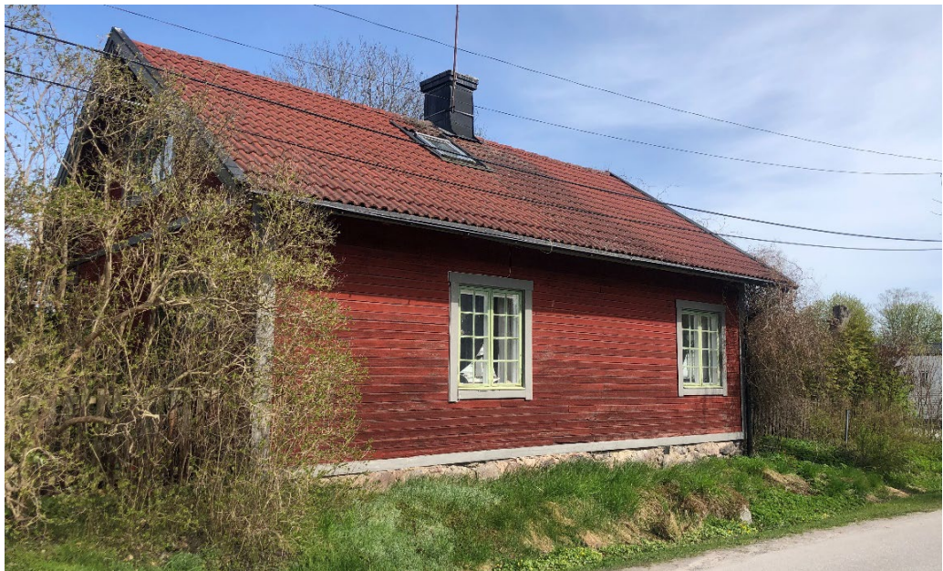
Trädgårdsmästarebostaden som tillhörde Breviks gård.

Av den allra äldsta bebyggelsen i Brevik finns i dag endast Breviks gårds lilla trädgårdsmästarebostad från 1700–1800-talet kvar (Trädgården 5).