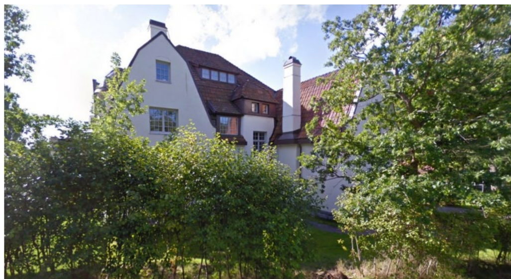
Vetet 10 från 1909 ritad av arkitekter Ferdinand Boberg och Bror Almqvist.

Den största och mest monumentala villan lät dock villastadens skapare Allan Abenius uppföra som sin egen privatvilla 1909, på Vetet 10, ritad av arkitekterna Ferdinand Boberg (1860-1946) och Bror Almqvist (1864-1940). De tunga byggnadsvolymer med ljusa slätputsade fasader, stora tegeltäckta brutna takfall, gavelutsprång och spetsiga frontespiser ger byggnaden en stark karaktär i en blandning av jugend och nationalromantisk arkitektur.