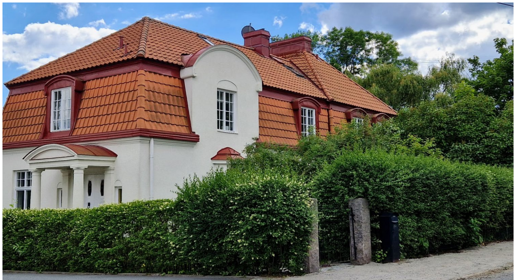
Parvillan inom Trädgården 7 och 20, en av två parvillor från 1912 som ligger bredvid varandra.