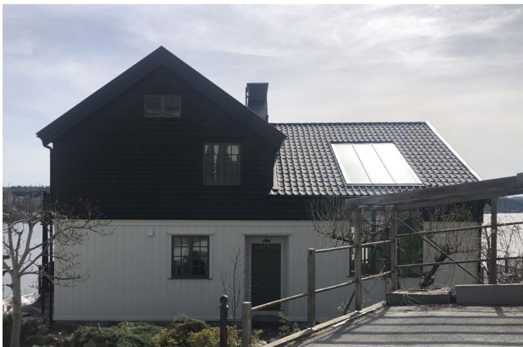
En mindre villa i ljus träpanel och tjärnörk övervåning är Utsikten 10 som uppfördes av konstnären Tyra Kleen 1907 och därför har stort personhistoriskt värde, okänd arkitekt.

En elegant utformad klassicistisk villa är Högudden 1 som egentligen är en villa från Djurgården, flyttad till Brevik och ombyggd 1913, kallad Villa Krängelberga.