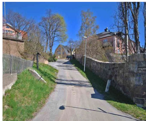
Vid Höguddens brygga ligger Strandboden från 1912 i mäktig mursten. (Lidingö 11:419.) Kullavägen vid Högudden 1.

Villa Högberga (Högudden 30) stod klar 1911 på Höguddens högsta punkt som en av Sveriges mest magnifika privatvillor i nationalromantik. Anläggningen med sina passager och trappor, mäktiga tegelmurverk och höga tegeltak är starkt präglad av inhemsk arkitektur från medel- och vasatid. År 1916 byggdes en kinesiskt inspirerad tillbyggnad. En monumental trädgårdsanläggning inramar villan framför allt mot sjösidan. Högberga är sedan 1964 kursgård och kallas Högberga gård. Flera kompletterande verksamhetsbyggnader i rött tegel har uppförts för verksamheten. Villa Högberga är ett byggnadsminne sedan 1985.