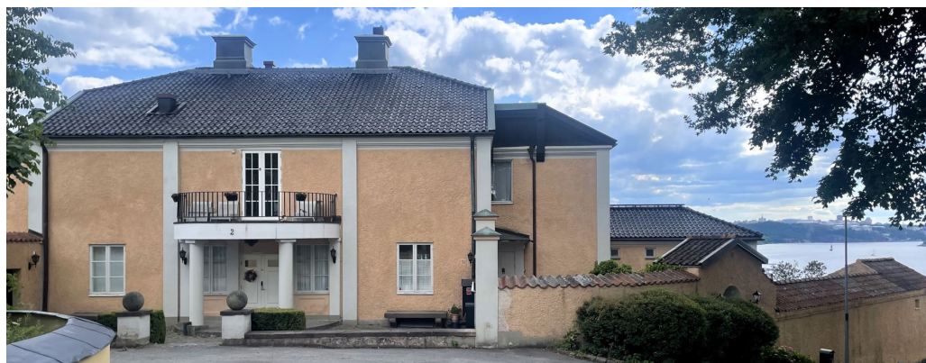
Den så kallade Villa Krångelberga på fastigheten Högudden 1.