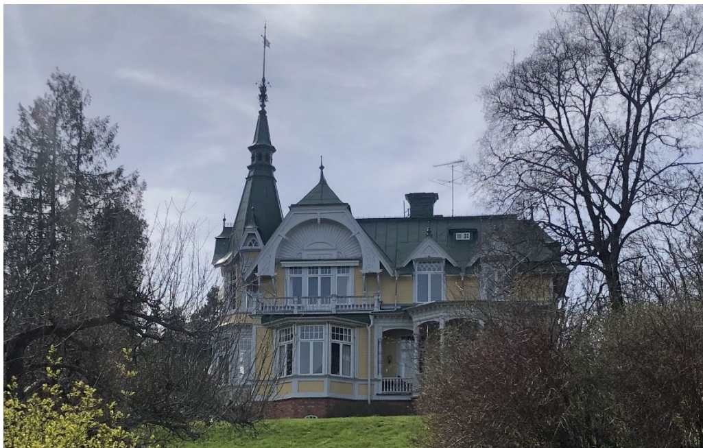
Villa Högudden från 1895 är en av de bäst bevarade stora sommarvillorna i Stockholms skärgård. Arkitekt Erik Lundroth.

Ett karaktärsfullt inslag i kulturmiljön kring Sjöstigen är Höguddens brygga och Strandboden (Lidingö 11:419) nere vid vattnet. Strandboden från 1912 med sina mäktiga murade stenväggar är egentligen en överbyggd passage till strandpromenaden nedanför Högudden.