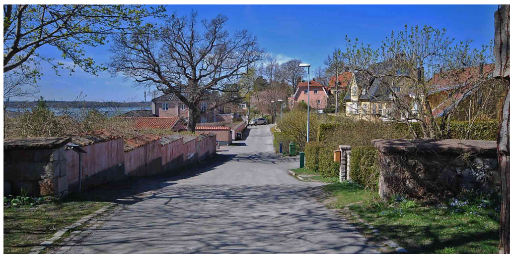
Grindstigen går västerut från Högbergas port mellan villorna i kvarteret Högudden.

På ovasidan av Sjöstigen ligger villorna bland bergknallar uppe i den branta sluttningen. På nedre sidan av gatan, i kvarteret Utsikten, ligger villorna lågt nere i sjösluttningen, orienterade ut mot sundet. Karaktärsfulla inslag kring Sjöstigen är äldre villatomter med trädgårdar, höga stödmurar och terrasseringsar, framför allt anläggningen i sluttningen på Högudden 1. Stenmurar, klippta häckar eller traditionella spjälstaket avgränsar flera villatomter mot Sjöstigen och Grindstigen.