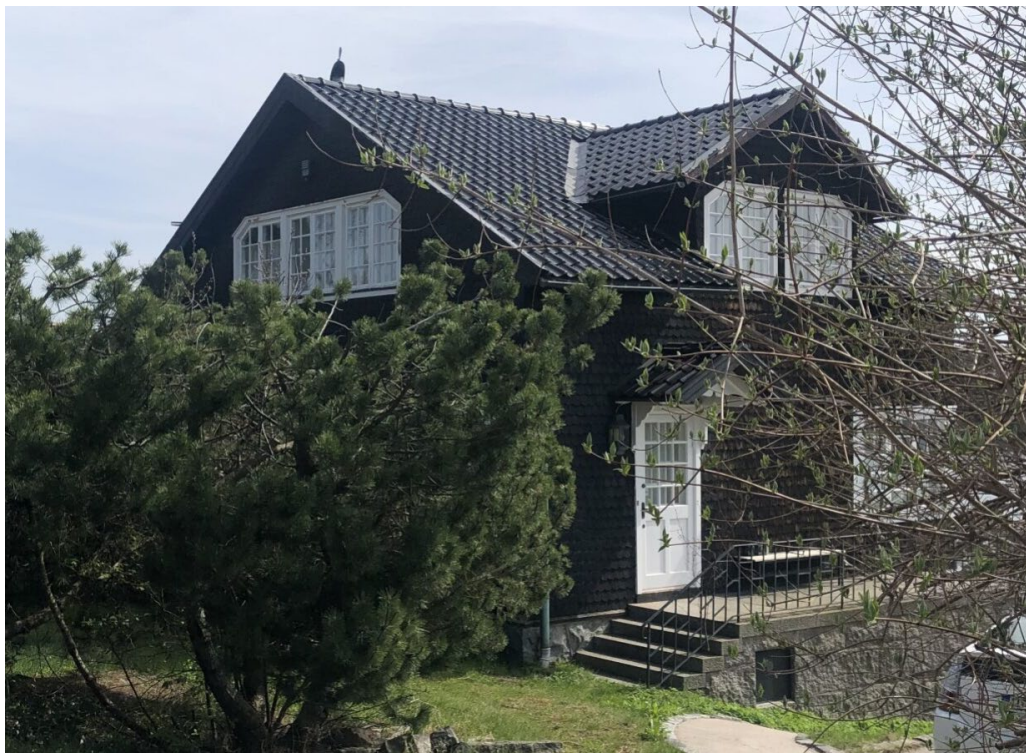
På 1910-talet byggdes flera andra villor i området. En speciell karaktär har den svarttjärade Utsikten 24, ritad av arkitekt Ferdinand Boberg.