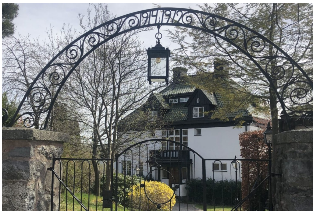
Utsikten 19 är ytterligare en imponerande privatvilla och uppfördes 1912 av direktör Birger Ljungström vid Ljungströms ångturbiner.