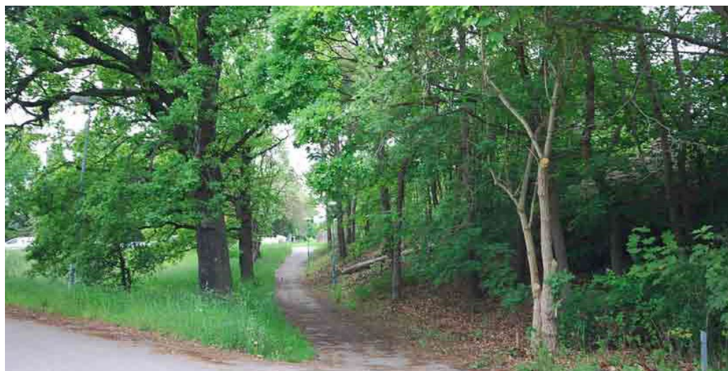
Allén av ädellövträd vid Mölna gård.

Mot söder inramar ekshagslandskapet dalgången ner mot Mölna gård. Den numera mycket smala ådalgången är i dag närmast en bäck som kantas av lövträd och buskage. Den lilla industrimiljön med lämningarna av flera hundra års kvarnhantering döljs i grönskan längs ån. Kvarndriften med medeltida anor avslutades i och med att den sista kvarnbyggnaden revs 1943. Här finns rikliga lämningar i form av kvarngrunder, damm, kvarnhjulsränna samt rester av dämmen och stenskoningar.