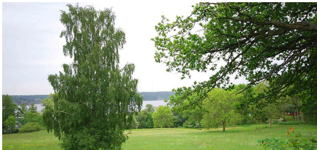
Kulturlandskapet vid Mölna gård i sluttningen mot sundet.

Mölna gård är känd sedan 1500-talet men har sannolikt ursprung från medeltiden. Så länge har kvarnverksamhet bedrivits i sluttningen längs Mölnaån som liksom gården bör ha fått namn av kvarnen. Gården ligger på en höjd ovanför åns utflöde i Saltsjön. Här var förr en strid ström som gav den vattenkraft som var nödvändig för en aktiv kvarndrift. Kvarnverksamheten har bedrivits längs en längre sträcka uppe i sluttningen ovanför gården och finns dokumenterad från åtminstone 1600-talets senare del till 1870-talet slut.