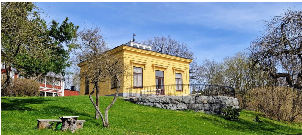
Paviljongen nedanför Mölna gård.

Mölna gård ligger på en markerad förhöjning ovanför Mölnaåns utflöde i Halvkakssundet. En murad stödmur ramar in tomten med paviljongen ovanför strandpromenaden. Blommande buskar och träd inramar den gula putsade paviljongen utförd i italiensk klassicism 1877. Detta är den mest välbevarade äldre byggnaden på Mölna och den har ett exponerat läge ut mot sundet.