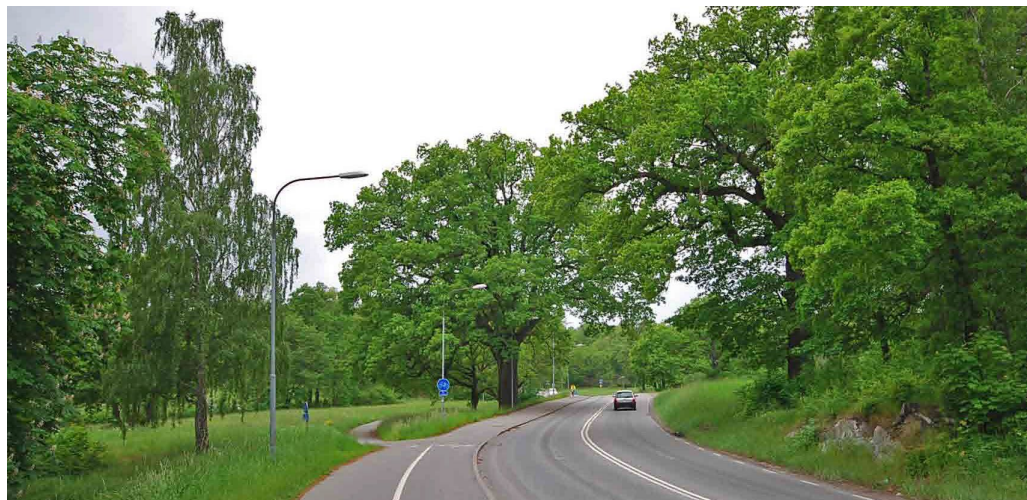
Norr om Mölna gård genomkorsas Mölna ängar med ekshagslandskapet av Södra Kungsvägen.

numera på tvärs genom området. Ett stycke ovanför Södra Kungsvägen finns även Lidingöbanans välbevarade järnvägsbro i sten från 1914. Ekshagslandskapet är en av södra Lidingös mest karaktärsfulla miljöer där natur- och kulturvärden samspelar i helhetsupplevelsen. Här ringlar smala gångvägar fram som används av många.