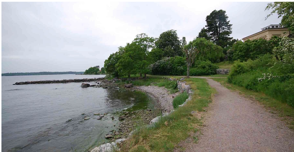
Vy från Mölna brygga längs strandpromenaden mot piren och den klassicistiska paviljongen på Mölna gård.

och en liten upplagd stenpir. Mölna brygga har under flera hundra år varit gårdens och kvarndriftens lastplats. Under 1800-talets senare del fick bryggan en ny roll som knutpunkt i sommartrafiken mellan Stockholm och sommarvillorna vid Kottlasjön och Stockbysjön.