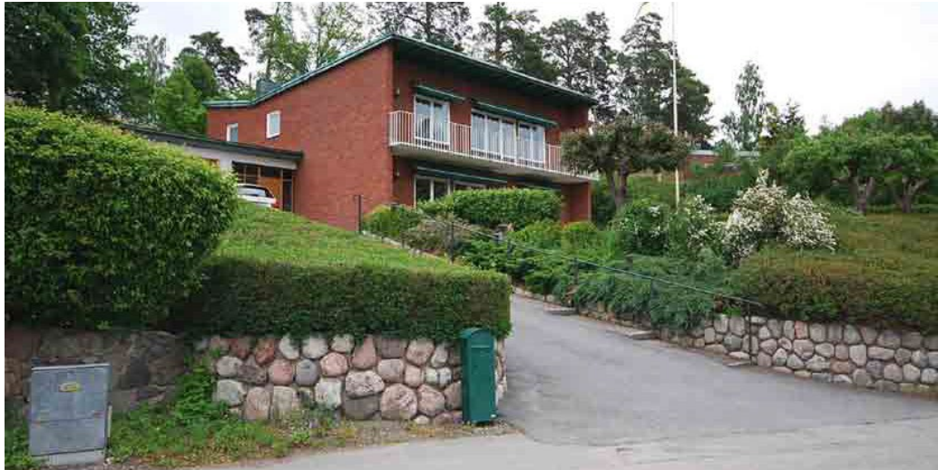
Mölnahöjden 2 från 1957 ritad av arkitekt Gustaf Lettström.