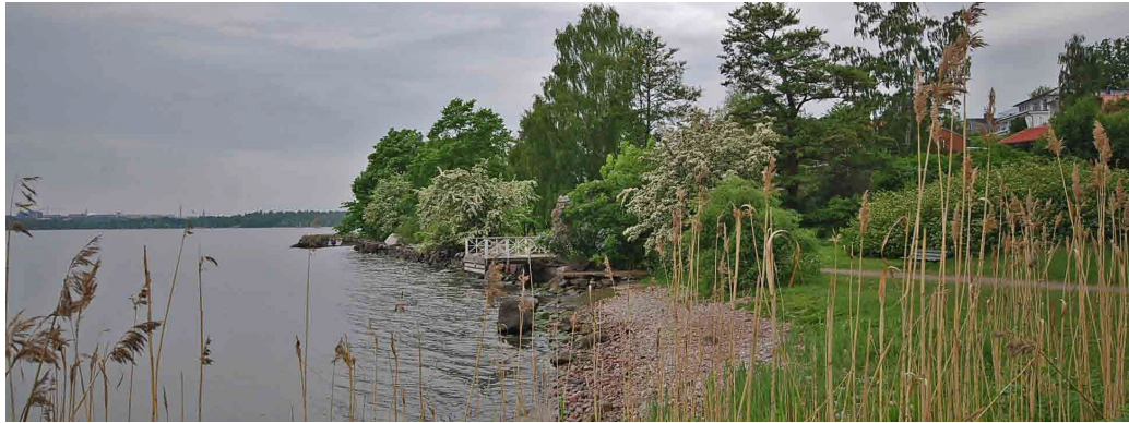
Vid stranden och strandpromenaden.

Området präglas helt av villabebyggelsen från 1950-talets senare del. Även tomtstrukturen med ungefär lika stora men primärt terränganpassade villatomter är väl bibehållen sedan byggnadstiden. Det helt dominerande intrycket av Mölnavägens villor är även i dag det väl avvägda samspelet mellan den sofistikerade villaarkitekturen, den goda landskapsanpassningen och villatomternas tidstypiska utformning i de delvis branta sluttningarna. Endast några villor som tillkommit på 1970-talet i Mölnabacken och Mölnahöjden har en mer typhuspräglad utformning, men de underordnar sig helhetsintrycket eftersom de är så få. De tre kvarteren har sinsemellan variationer i villornas utformning, bland annat eftersom flera arkitekter var verksamma och att husen anpassats efter terrängens växlande topografi.