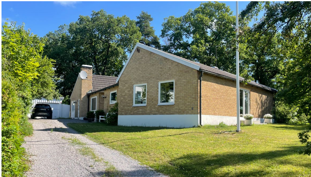
Mölnahöjden 9 från 1955 är ritad av arkitekt Tage Lycknert och är den enda i området med fasad i gult tegel.