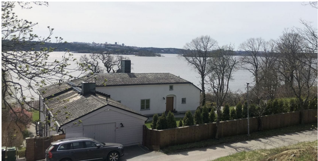
Villa Smith från norr.

I övrigt domineras Mölnastranden av en stramt modernistisk villaarkitektur i rött tegel, där även fasaderna mot gatan i flera fall är ett karaktäristiskt inslag. Kvarteret har också en särprägel genom de storslagna sjöfasaderna i 1 ½–2 våningar mot den gröna slänten ned mot strandpromenaden och vattnet. I sjöfasaden kontrasteras det röda teglet ofta mot inslag av vita fasadpartier samt de stora uppglasade fönsterpartier som vetter ut mot farleden. Flacka eller asymmetriska sadeltak eller pulpettak täcks i regel av mörk taktäckning i form av skiffer, papp eller betongpannor.