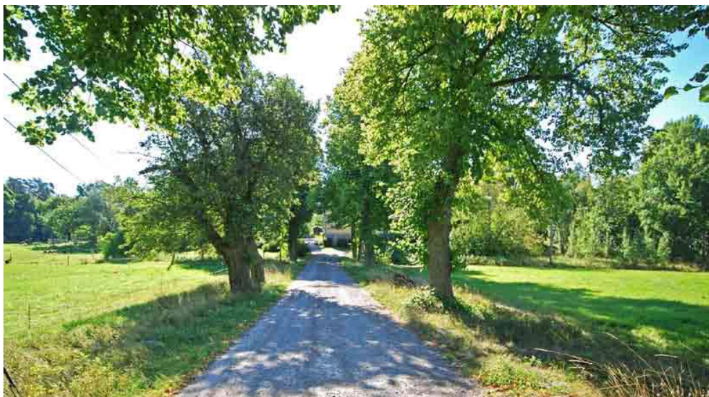
Östra Yttringe, gårdens allékantade väg.

Norra delen av området präglas helt av Östra Yttringe där kullar och ryggar med bland annat bergknallar, ekbackar och andra lövträd omges av flackare dalstråk. Yttringe har åtminstone medeltida hävd. Kulturlandskapet har sannolikt länge varit ängs- och betespräglad. Stråk av flackare åkermark är av yngre datum. Fortfarande finns en utpräglad hagmarkskaraktär även om randzonens tidigare beteshagar och smååkrar numera ofta är igenväxande. Lövträden växer i dungar och som stora solitärträd omväxlande med höga furor. Det småskaliga välbevarade kulturlandskapet med sina genuina småvägar har en opåverkad sammanhängande jordbrukskaraktär som är mycket viktig att ta till vara. Genom området går gångstigar från centrala Lidingö ut mot Elfviklandet.