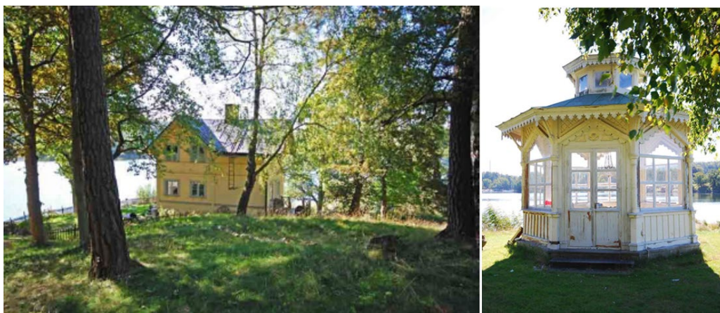
Villa Karlsro och den lilla glaspaviljongen.

Den stora vitmålade paviljongen med rikliga snickerier och stora spröjsade fönster är mycket ursprunglig även på detaljnivå. Karlsro med glaspaviljongen är som helhet en av Lidingös mest värdefulla miljöer från det sena 1800-talets stora sommarnöjepoch. Bellevue (Lidingö 6:25) är en sommarvilla från 1869 som renoverats till mer av 1940-talskaraktär under efterkrigstiden.