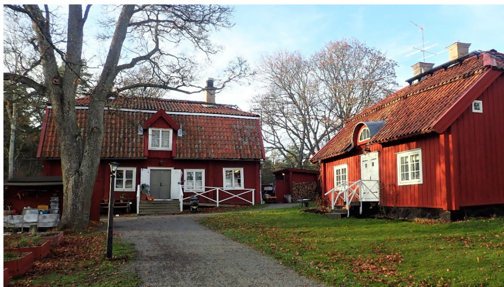
Långängens välbevarade mangårdsbyggnad från ca 1775 och flygel till höger från 1815–1817.

Mangården omfattar mangårdsbyggnad och bostadsflygel som båda är knuttimrade i en våning med vind och med fasad i locklistpanel och brädslagna pardörrar. De höga brutna taken med avvalmade gavelspetsar täcks av enkupigt taktegel. Mangårdsbyggnaden från ca 1775 har en sexdelad plan och en utformning som ofta förknippas med exempelvis små officersboställen eller prästgårdar under denna tid. Fönstren är på 1700-talsvis kvadratiska och fyrspröjsade. Bostadsflygeln från ca 1815–1817 har till skillnad från mangårdsbyggnaden tätspröjsade tvåluftsfönster och ett lunettfönster över entrén.