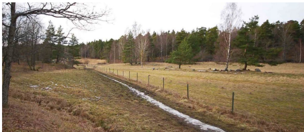
Vy över kulturlandskapet västsydväst om gården.

Mellan 1846 och fram till 1940, när gårdens aktiva tid som eget hemman börjar avta skedde en omfattande nyodling av åkermark. Under samma tidsperiod lades jordbruksdriften om till spannmålsproduktion. Långängens utveckling följer i stort den mellansvenska utvecklingen under den stora omvandlingsprocess som det svenska agrarsamhället genomgår under 1700-, 1800- och 1900-talet.